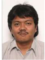
Dr. Albarda School of Electrical Engineering and Informatics Institut Teknologi Bandung (ITB), Indonesia. [Scopus] [Google Scholar] [Sinta]