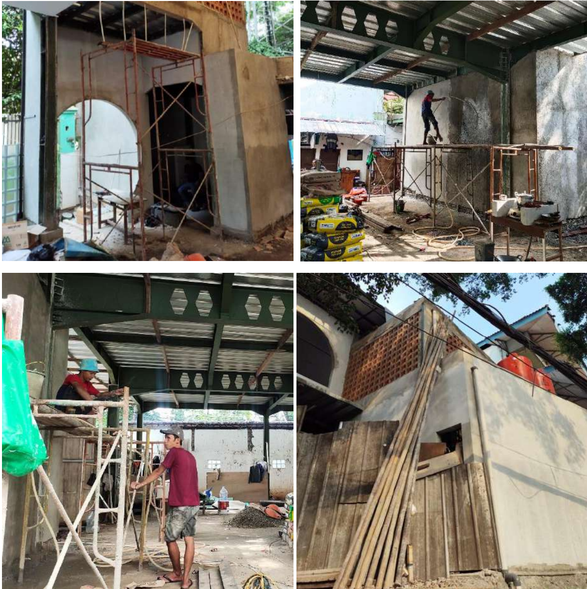
Gambar 2. Proses Pekerjaan Dinding Bata di Lantai 1