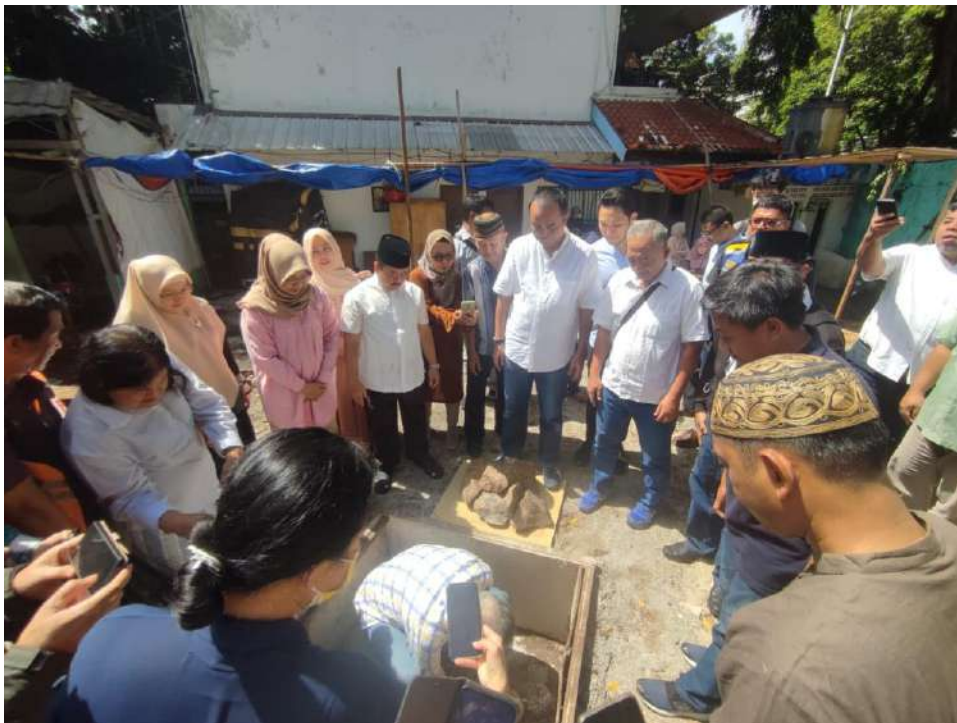
Gambar 1 Perletakkan Batu Pertama Pembangunan Masjid