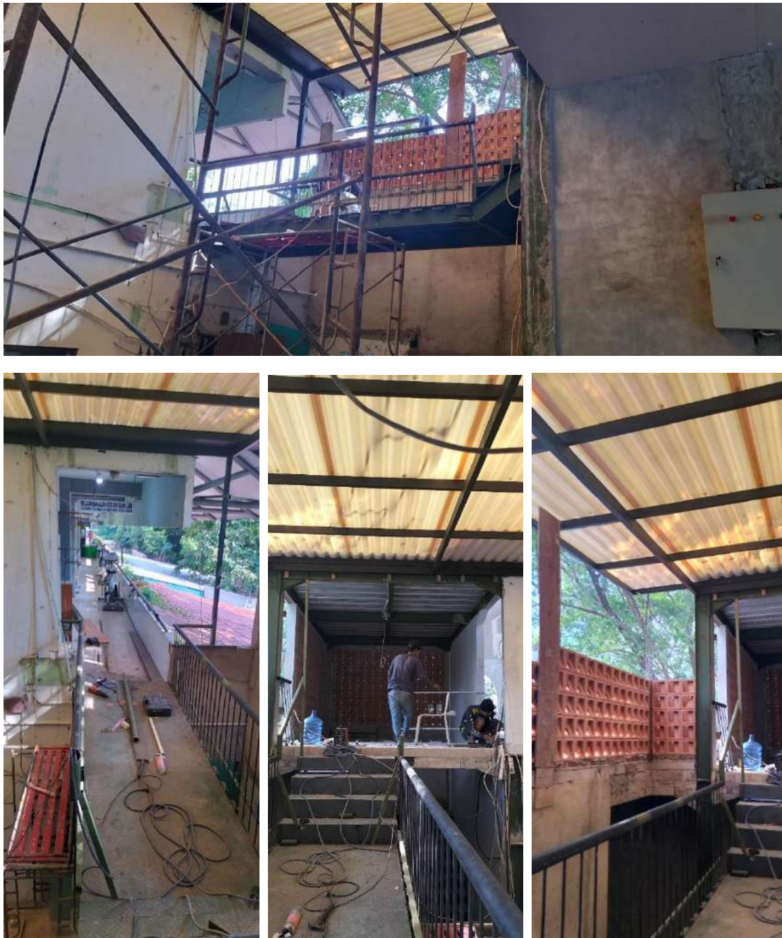
Gambar 25. Proses Pekerjaan Jembatan Penghubung Antara Bangunan Masjid dan SMA Negeri 24 (2)