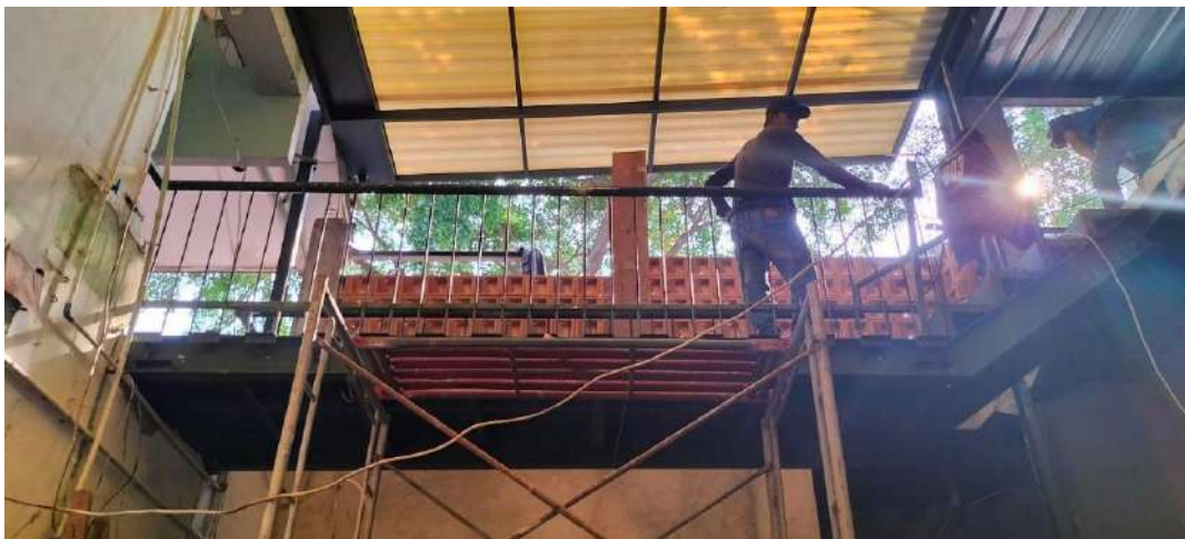
Gambar 24. Proses Pekerjaan Jembatan Penghubung Antara Bangunan Masjid dan SMA Negeri 24 (1)

Proses pekerjaan jembatan penghubung antara bangunan Masjid dan SMA Negeri 24 pada minggu kedua Juli 2024 telah sampai pada tahap penyelesaian pemasangan railing tangga yang mencapai 95%.