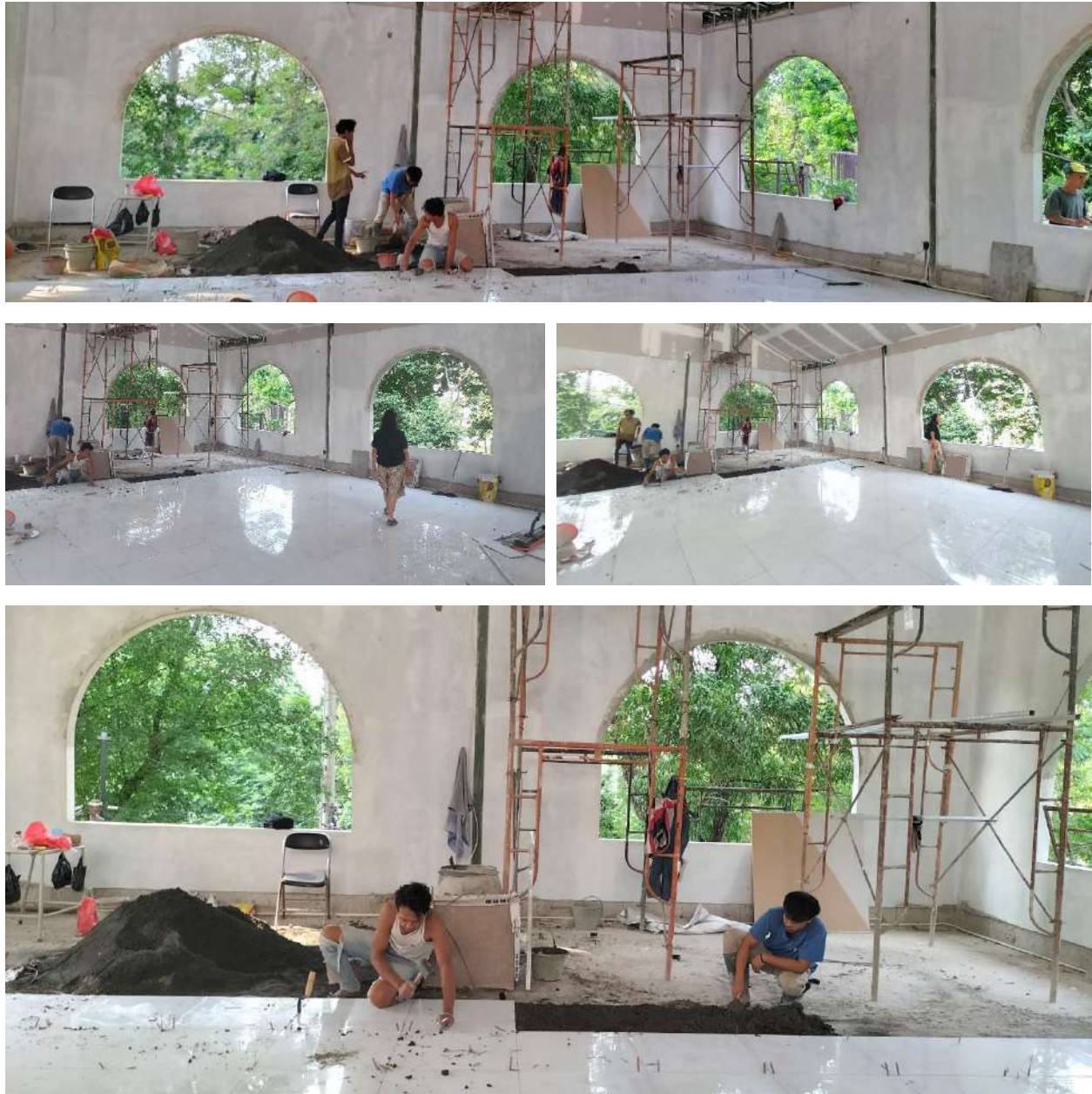
Gambar 11. Proses Pekerjaan Pemasangan Keramik pada Lantai 2