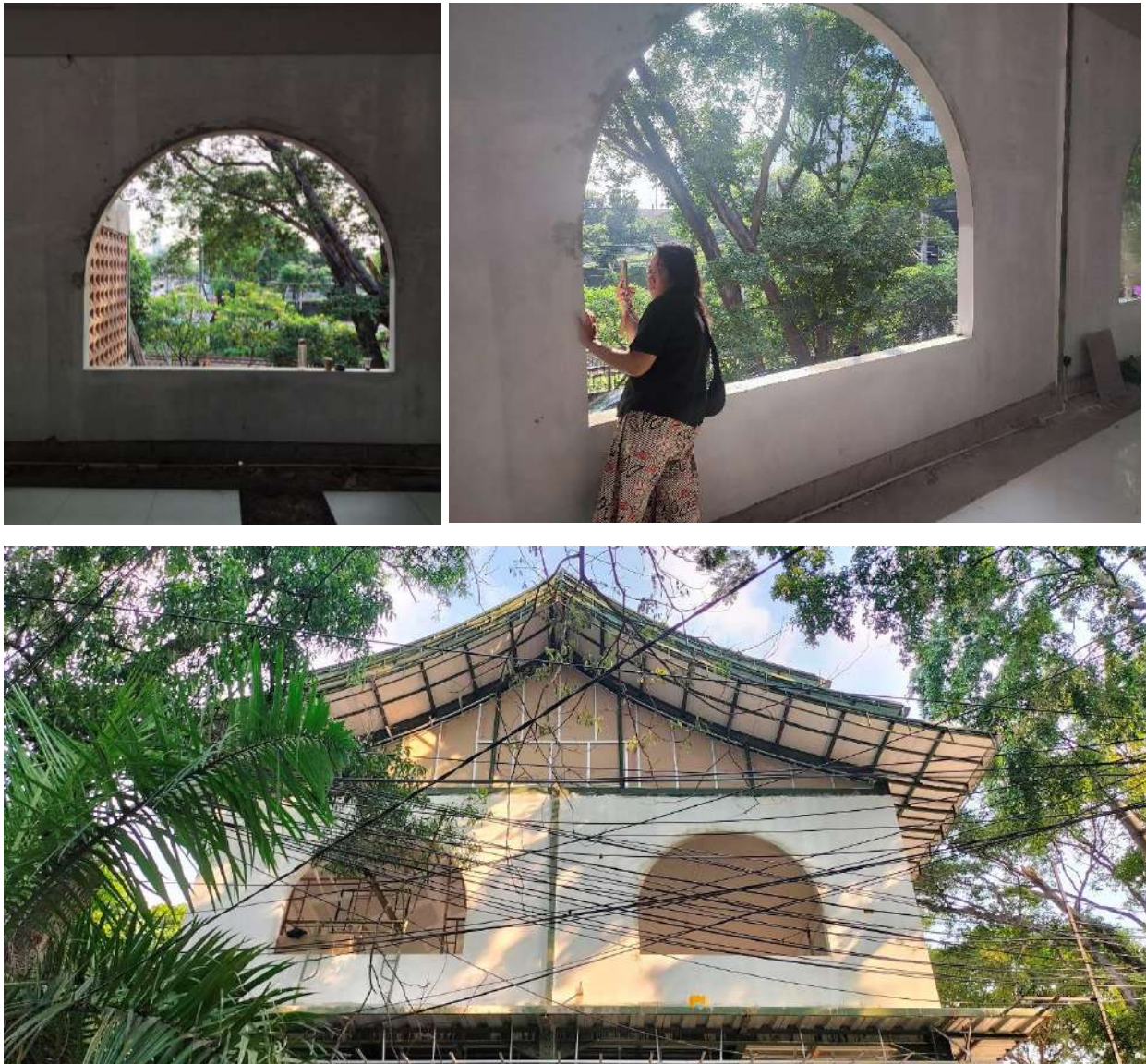
Gambar 21. Proses Pekerjaan Bukaan (Jendela) pada Lantai 1