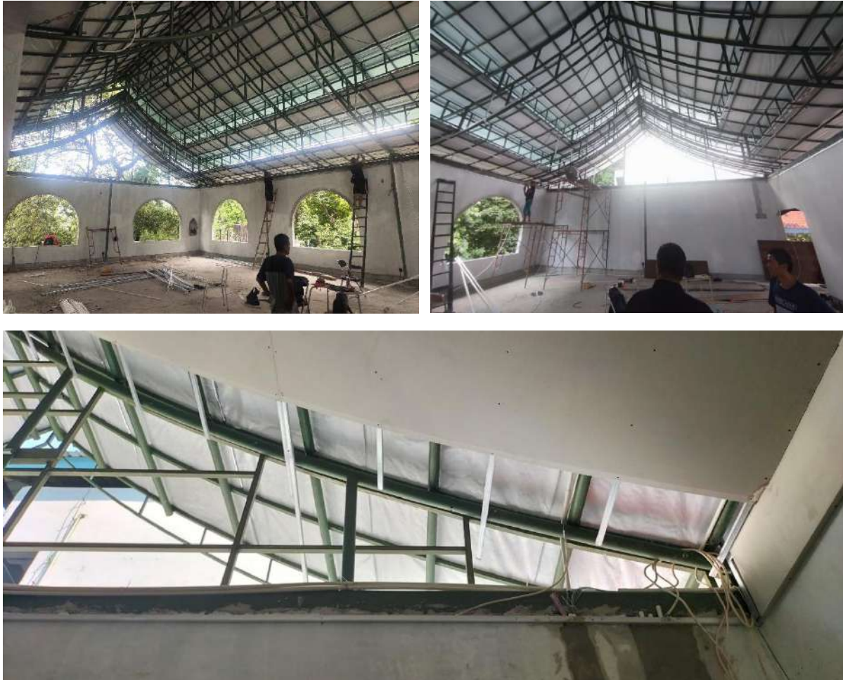
Gambar 18. Rangka Atap Lantai 2