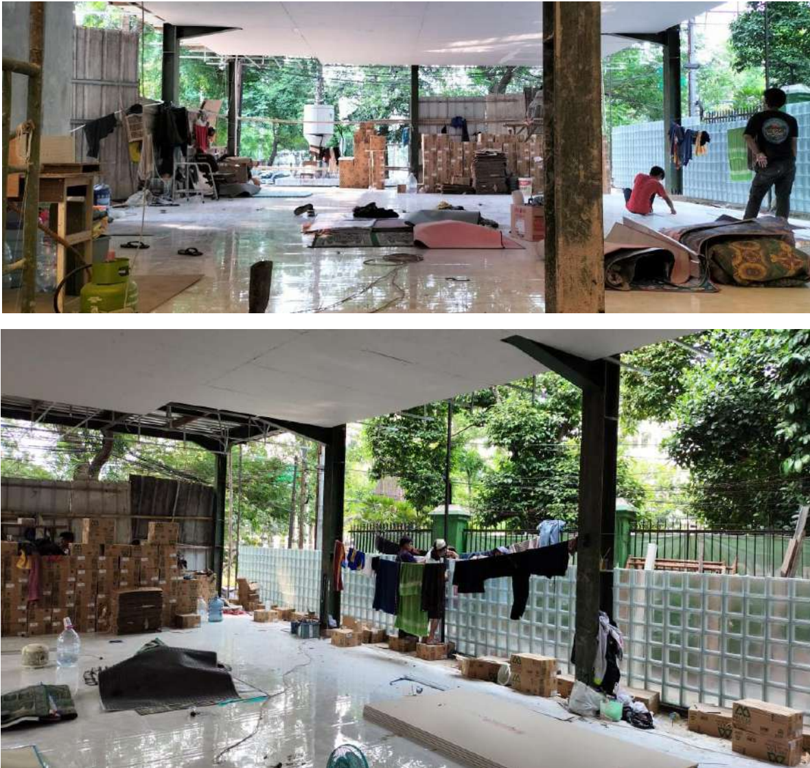
Gambar 9. Proses Pekerjaan Pemasangan Keramik pada Lantai 1