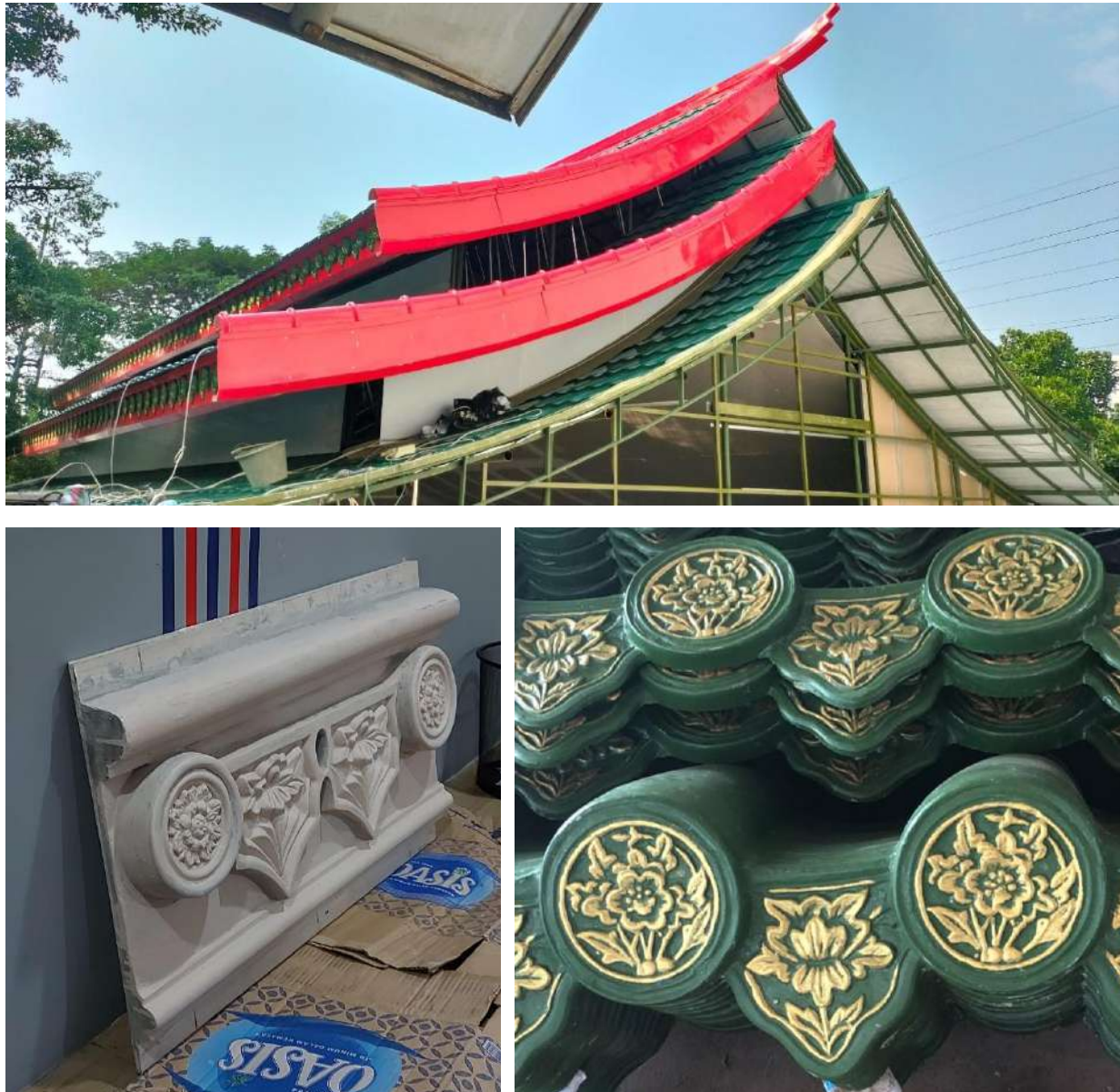
Gambar 16. Listplank dan Detail Ornamen Atap