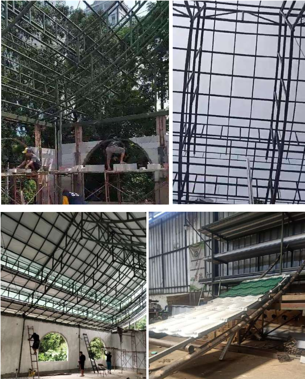
Gambar 17. Proses Pekerjaan Pemasangan Rangka Atap dan Penutup Atap Lantai II (1)

Proses pemasangan rangka atap telah dimulai pada minggu pertama Mei 2024 dan penutup atap pada minggu pertama Juni 2024. Rangka atap menggunakan bahan rangka CNP dan material penutup atap menggunakan material genteng metal.