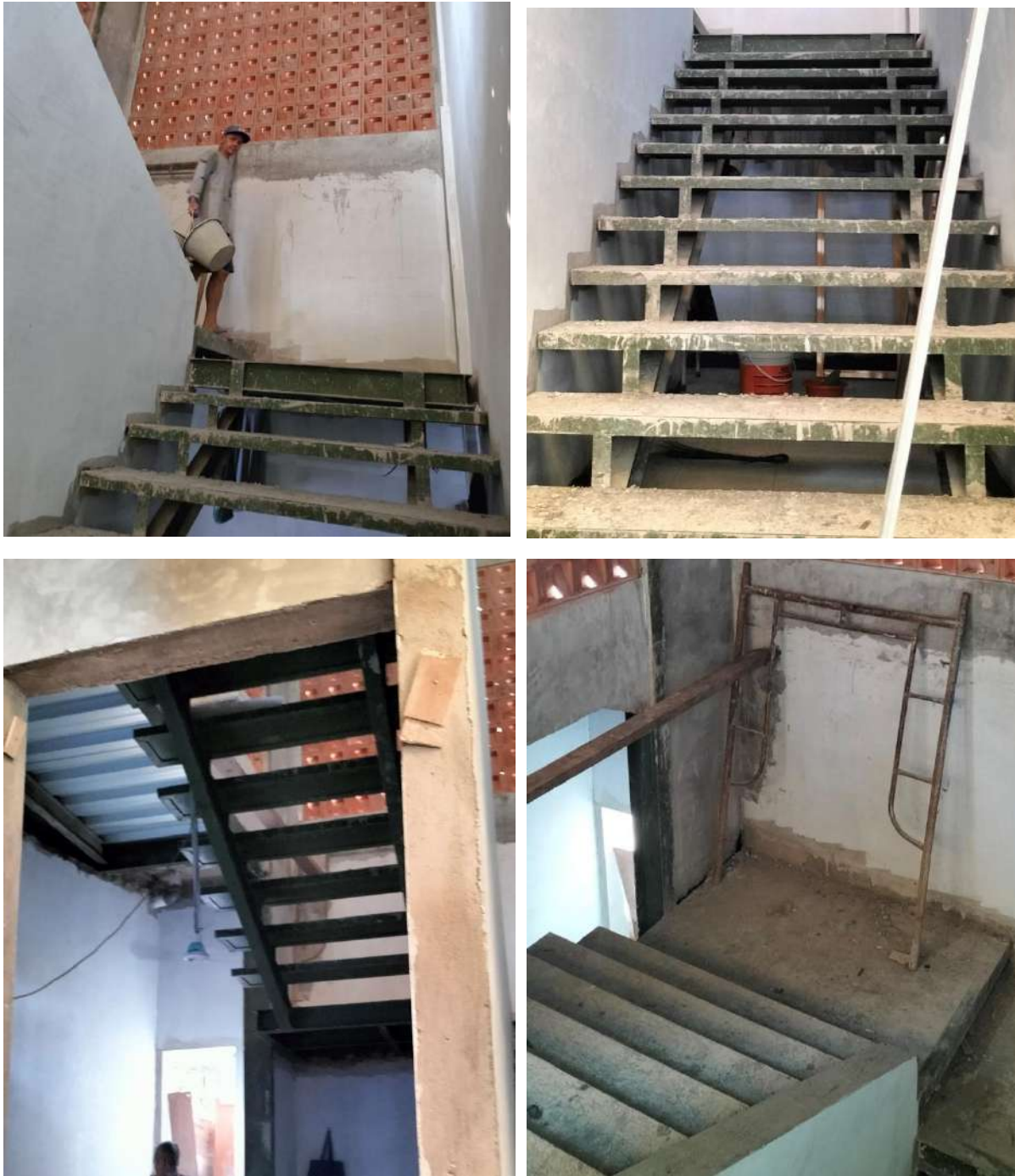
Gambar 26. Proses Pekerjaan Tangga