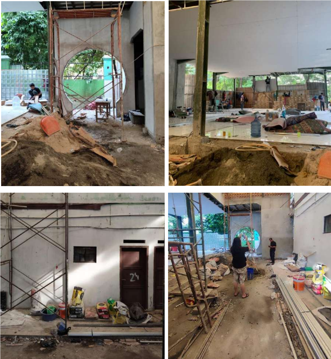
Gambar 12. Proses Pekerjaan Lantai Penghubung Bangunan Masjid dengan SMA Negeri 24 di Lantai 1