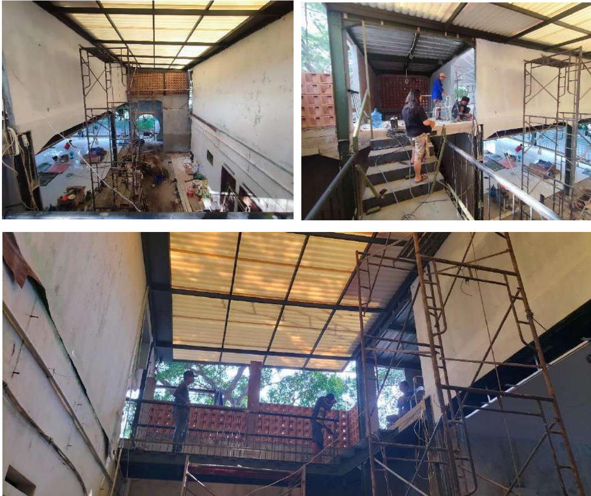
Gambar 19. Proses Pekerjaan Rangka dan Penutup Atap Penghubung Bangunan Existing dengan Masjid