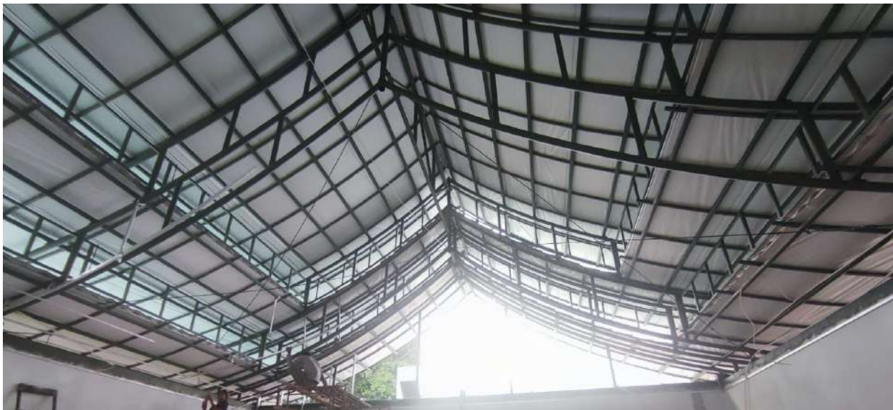
Gambar 15. Proses Pekerjaan Rangka Plafon Dalam Lantai 1 dan 2