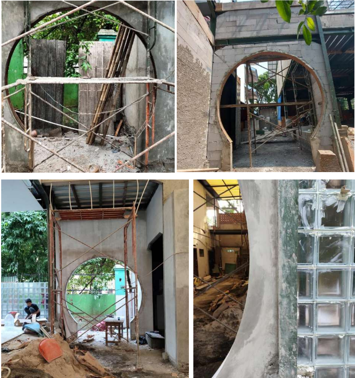
Gambar 20. Proses Pekerjaan Bukaan pada Lantai 1

Pekerjaan bukaan pada pintu dan jendela di lantai 1 meliputi bukaan pada jendela dan pintu baik interior maupun eksterior. Secara keseluruhan pekerjaan bukaan sudah mencapai 80%, dengan sisa pekerjaan pada pengecatan dan penambahan ornamen pada tepian bukaan.