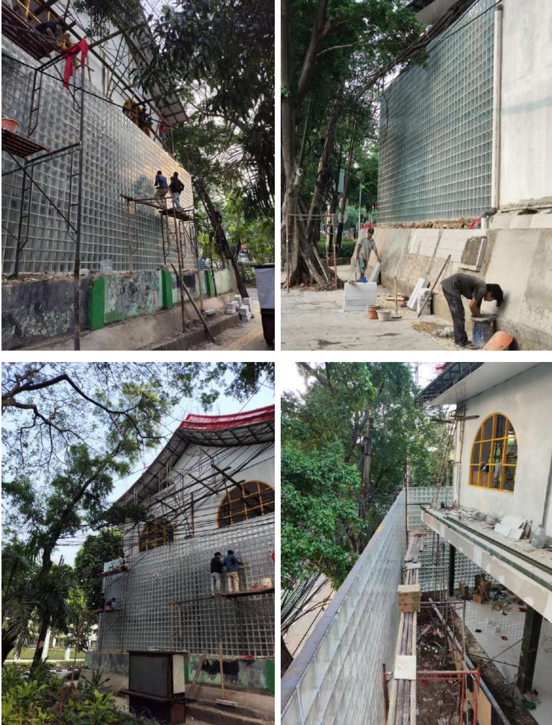
Gambar 6. Proses Pekerjaan Dinding Glass Box pada Lantai 1 sampai Minggu Kedua Agustus 2024