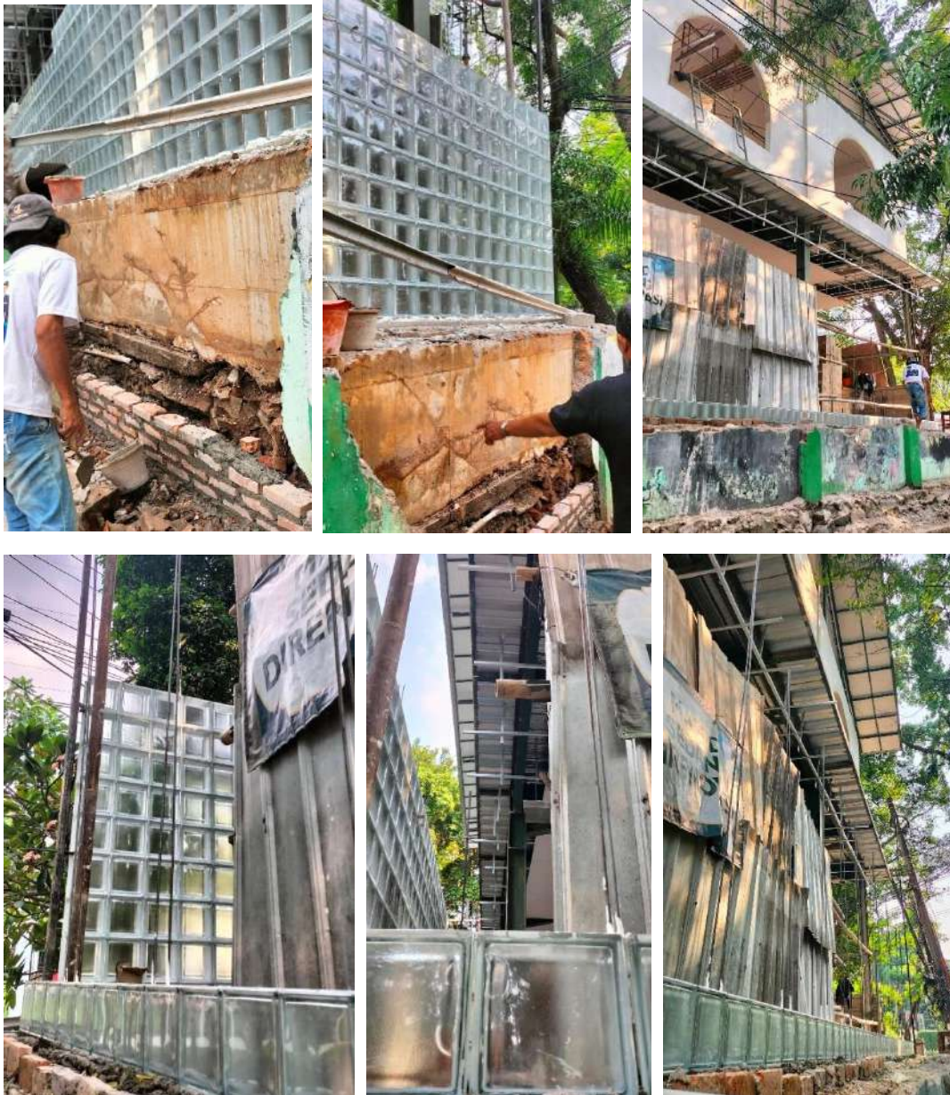
Gambar 23. Proses Pekerjaan Pagar Glass Box