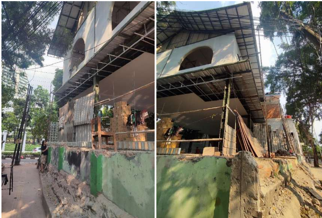
Gambar 22. Proses Pekerjaan Pemasangan Pagar Dinding Bata