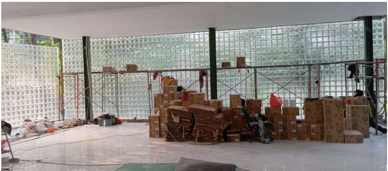
Gambar 4. Proses Pekerjaan Dinding Glass Box pada Lantai 1 sampai Minggu Keempat Juli 2024