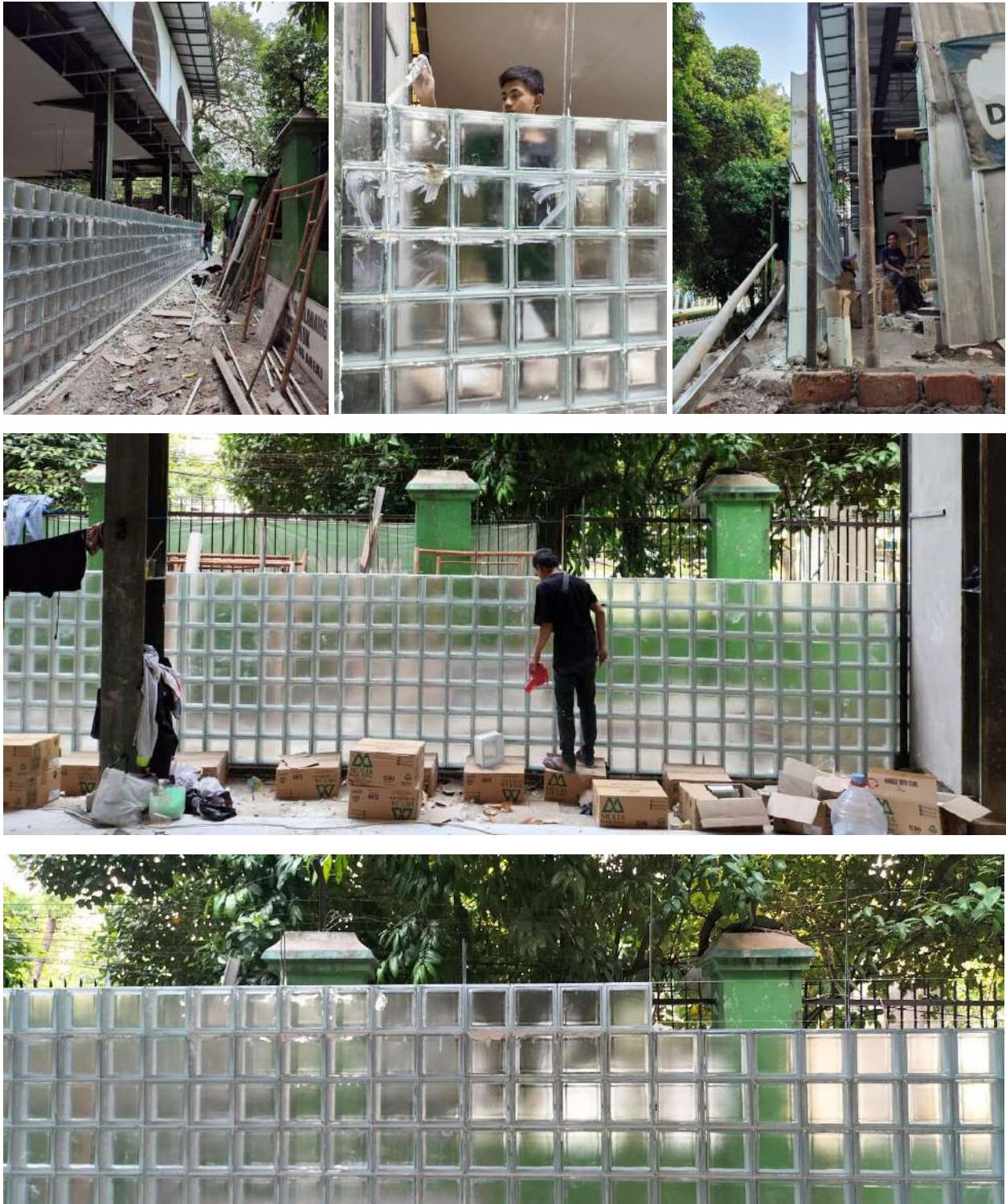
Gambar 3. Proses Pekerjaan Dinding Glass Box pada Lantai 1 sampai Minggu Kedua Juli 2024