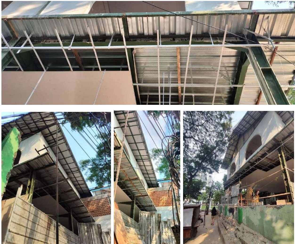
Gambar 14. Proses Pekerjaan Rangka Plafon Sisi Luar Lantai 1 dan 2