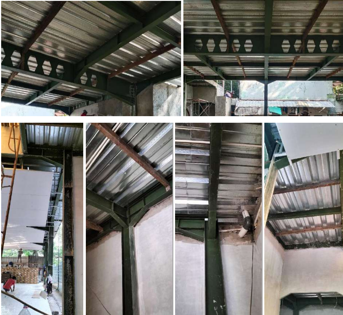
Gambar 10. Proses Pekerjaan Lantai Bodek pada Lantai 2