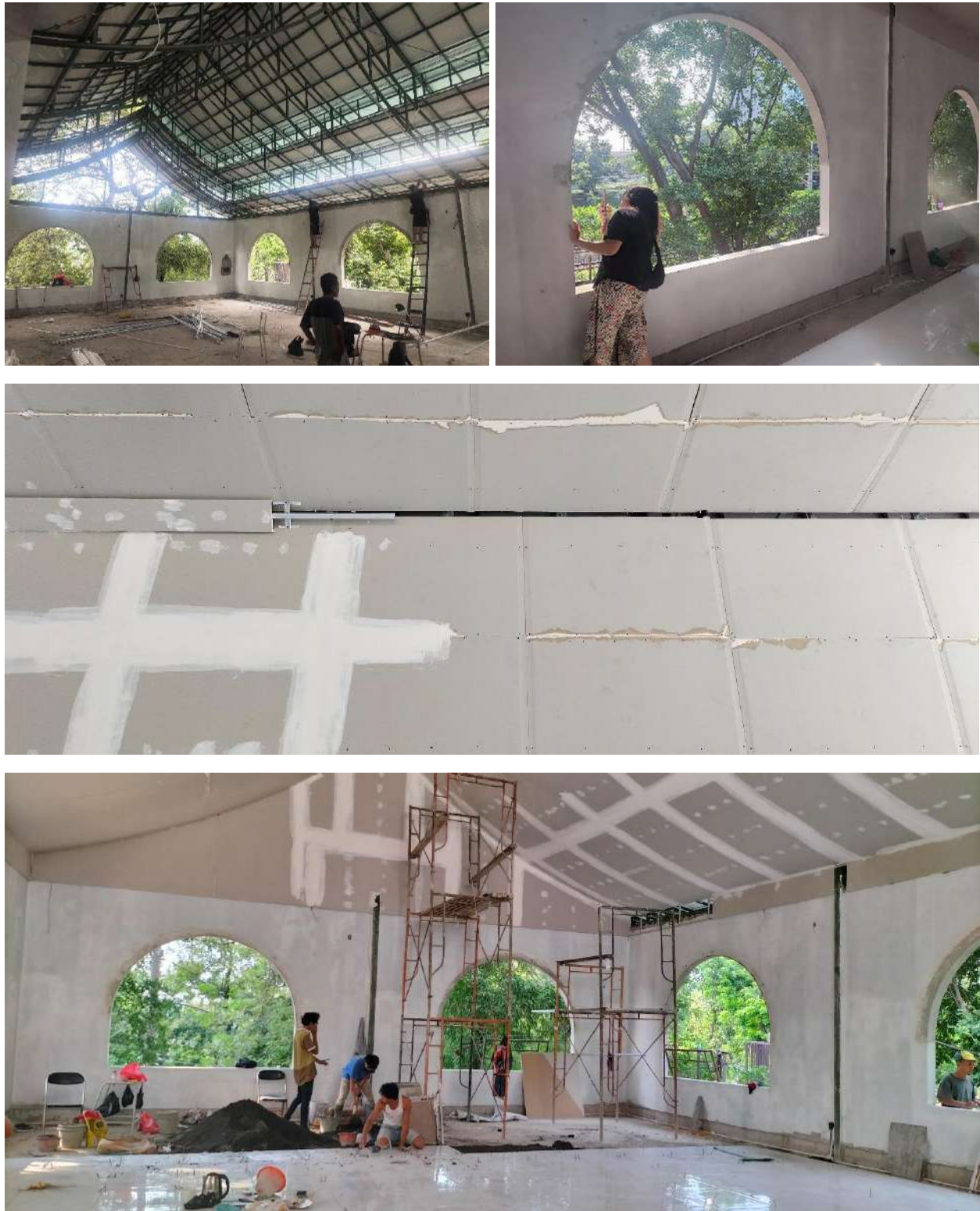
Gambar 7. Proses Pekerjaan Dinding Bata pada Lantai 2 sampai Minggu Kedua Juli 2024