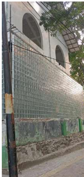
Gambar 5. Proses Pekerjaan Dinding Glass Box pada Lantai 1 sampai Minggu Keempat Juli 2024