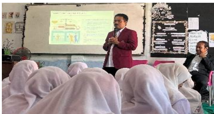
Pengabdian memberikan materi PKM kepada para siswa