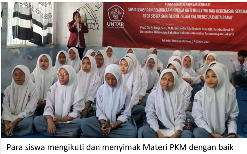
Para siswa mengikuti dan menyimak Materi PKM dengan baik

Pada umumnya para siswa sekolah SMA Fajrul Islam belum memahami hukum, sehingga tidak mengetahui perbuatan yang melanggar hukum dan tidak