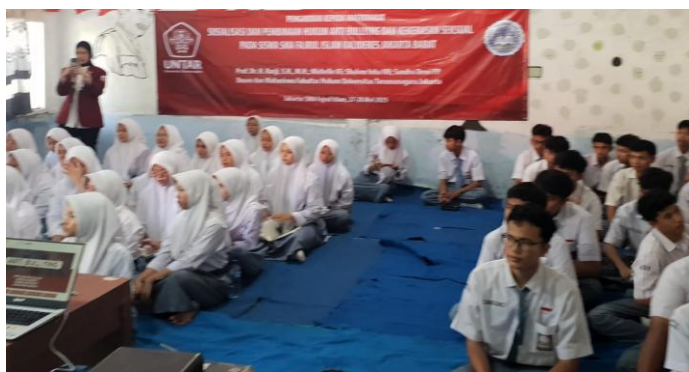
Para siswa mengikuti dan menyimak Materi PKM