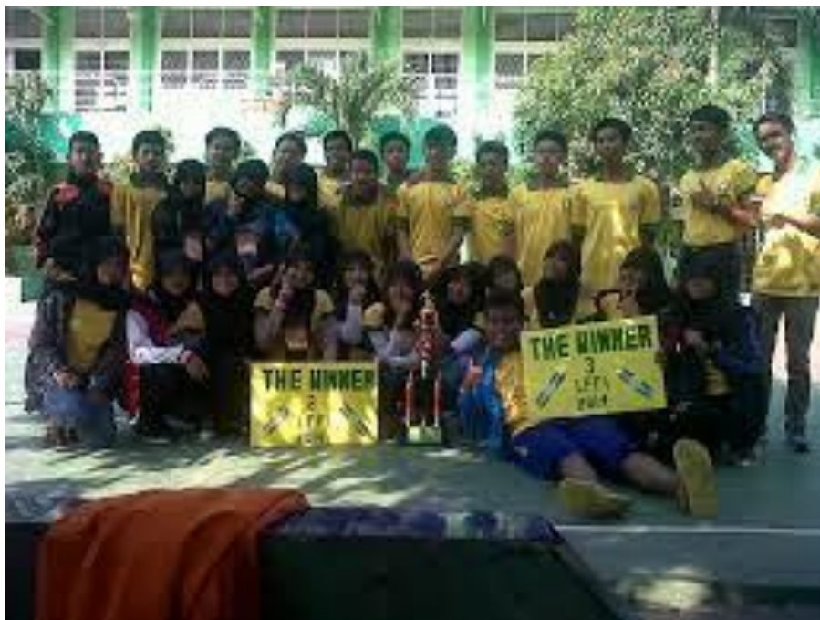
GEDUNG DAN SISWA SMA FAJRUL ISLAM KALIDERES JAKARTA BARAT