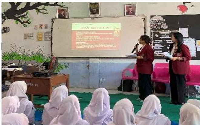
Mahasiswa Pengabdi Memberikan Materi PKM