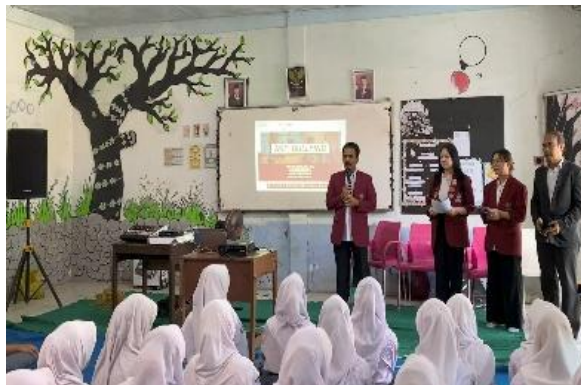
Tim Pengabdian Memberikan Kata Sambutan

Tindakan perundungan ( bullying ) dan kekerasan seksual adalah dua tindakan negatif yang banyak terjadi di lingkungan sekolah. Banyak siswa sekolah yang bertindak sebagai pelaku bullying dan/atau kekerasan seksual. Demikian juga banyak siswa sekolah yang menjadi korban dari tindakan bullying dan/atau kekerasan seksual. Setiap siswa harus menjaga diri untuk tidak menjadi pelaku atau korban dari tindakan bullying dan/atau kekerasan seksual, agar cita-citanya tidak kandas. Banyak siswa sekolah yang menjadi pelaku atau korban kedua tindakan tersebut, yang berujung pada putus sekolah, yang pada akhirnya gagal mencapai cita-citanya. Untuk itu Universitas Tarumanagara, melalui tim Pengabdian, peduli terhadap upaya pencegahan timbulnya perilaku bullying dan kekerasan terhadap siswa sekolah melalui kegiatan sosialisasi dan pembinaan hukum anti bullying dan kekerasan seksual. Sambutan perwakilan pengabdian diakhiri dengan harapan agar para siswa sekolah mencegah diri untuk tidak menjadi korban atau pelaku perundungan atau kekerasan seksual.