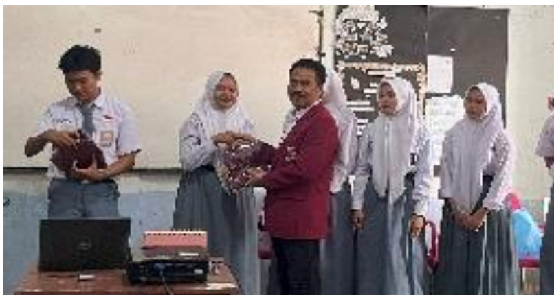
Siswa menjawab pertanyaan dengan benar dapat hadiah

Pengabdian memandang para siswa sekolah adalah generasi muda yang harus dipersiapkan menjadi pemimpin Bangsa Indonesia. Karena itu, remaja sekolah perlu dibekali pengetahuan dan keahlian, khususnya pengetahuan dan keahlian anti kekerasan seksual dan anti perundungan. Salah satu upaya yang dapat dilakukan pengabdian adalah melakukan kegiatan PKM dengan tema sebagaimana dikemukakan di awal. Melalui kegiatan ini, pengabdian berusaha memberikan materi hukum tentang anti kekerasan seksual dan anti perundungan, melalui kegiatan sosialisasi dan pembinaan hukum anti kekerasan seksual dan anti perundungan kepada para siswa sekolah SMA Fajrul Islam Kabupaten Tangerang.