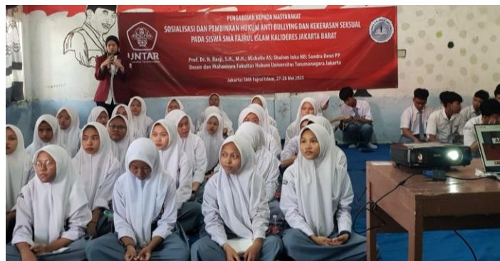
Para siswa mengikuti dan menyimak Materi PKM

Salin itu, usia remaja ada usia yang memucikan orang untuk melakukan aktivitas coba-coba, untuk mengetahui identitas diri dan kemampuan dirinya. Pada sisi lain, para remaja ini belum mengetahui bagaimana tanggung jawab yang harus diberikan atas