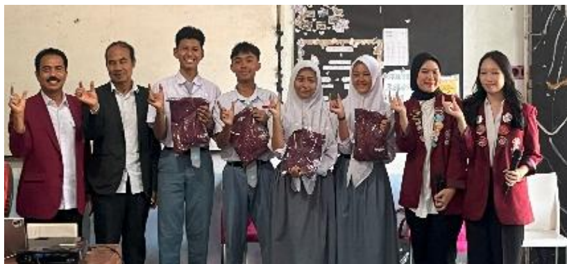
Para siswa mendapatkan cindera mata

Selain itu, berdasarkan hasil kuesioner yang dibagikan oleh pengabdian kepada para siswa, para siswa sekolah SMA Fajrul Islam telah berhasil meningkatkan pemahaman hukum tentang anti kekerasan seksual dan