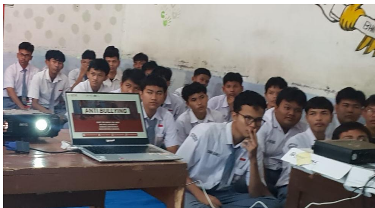
Para siswa mengikuti Materi PKM dengan antusias

Setiap korban kekerasan seksual akan mengalami penderitaan yang sangat dalam. Selain kehilangan kehormatan diri, kehilangan harga diri, dapat terkenal penyakit kelamin, kehamilan yang tiak diharapkan, direndahkan oleh orang lain, menderita lahir dan batin,