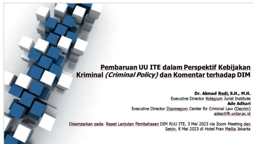
Gambar 1 Pelaksanaan PKM

Hukum pidana bertujuan untuk mengoptimalkan keadaan yang terjadi dalam suatu kehidupan masyarakat dengan menanggulangi kejahatan dan berfokus kepada para pihak yang terlibat yaitu pelaku, korban maupun masyarakat. Penegakan hukum, nilai hukum, dan substansi hukum serta struktur hukum juga menjadi fokus dalam kebijakan hukum pidana untuk melahirkan suatu peraturan perundang-undangan yang berdaya guna.