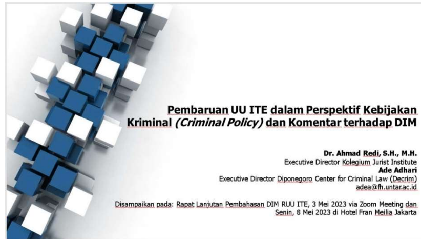
Gambar 1 Pelaksanaan PKM

Hukum pidana bertujuan untuk mengoptimalkan keadaan yang terjadi dalam suatu kehidupan masyarakat dengan menanggulangi kejahatan dan berfokus kepada para pihak yang terlibat yaitu pelaku, korban maupun masyarakat. Penegakan hukum, nilai hukum, dan substansi hukum serta struktur hukum juga menjadi fokus dalam kebijakan hukum pidana untuk melahirkan suatu peraturan perundang-undangan yang berdaya guna.