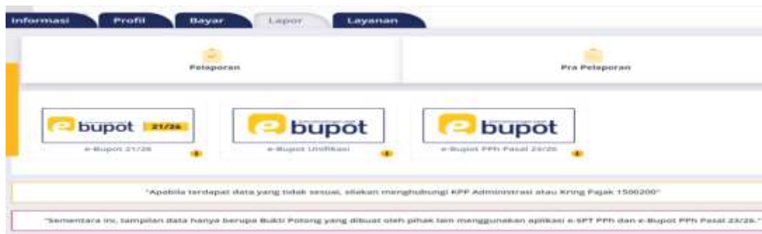
Tabel 4.3 menu-menu dalam e-bupot