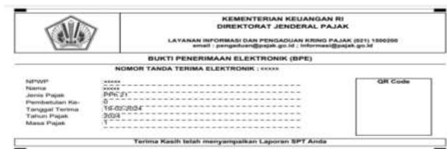
Tabel 4.4 Bukti Penerimaan SPT masa secara elektronik