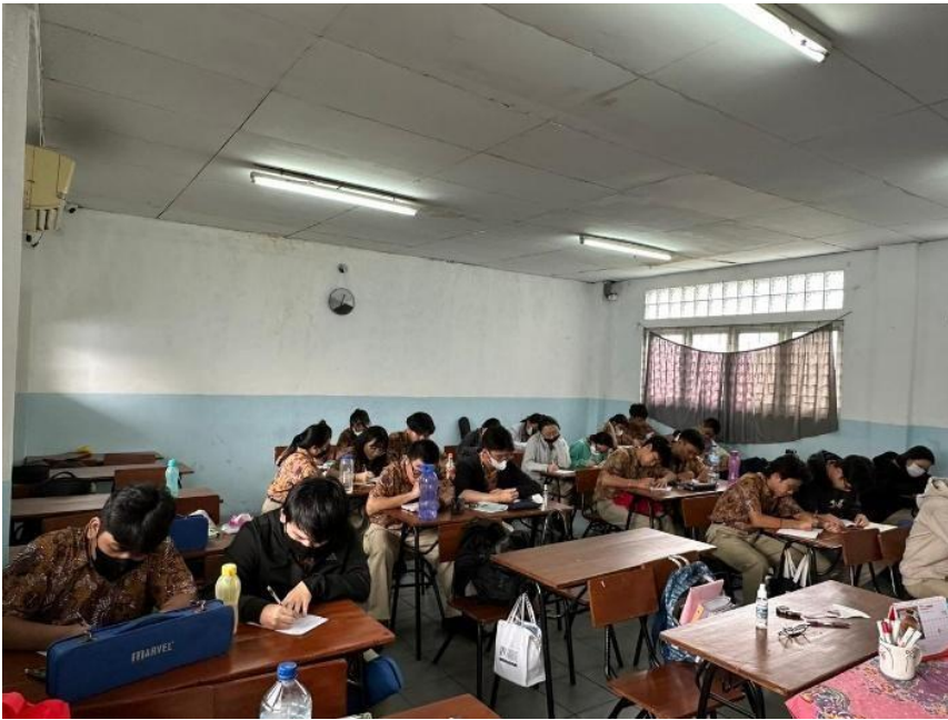
Gambar 2. Dokumentasi Sesi Pelaksanaan Pelatihan

modul secara tutorial. Materi yang diberikan terdiri dari: pengertian piutang, jenis-jenis piutang, cara mencatat dan menilai piutang dagang, dan akuntansi untuk piutang tidak tertagih. Sebelum pemaparan diberikan, peserta pelatihan diberikan tanya jawab seputar ilmu akuntansi yang telah diperoleh di sekolah dan pengetahuan mereka terhadap piutang, namun ternyata materi yang mereka dapatkan hanya meliputi akuntansi dasar dan tidak memahami tentang piutang dagang. Hasil yang diperoleh dari sesi pertama ini adalah materi yang kami sampaikan dapat diikuti dengan baik dan antusias oleh siswa. Hal ini terlihat dari cara mereka memperhatikan dan mencatat penjelasan yang disampaikan oleh Tim PKM. Berikut adalah dokumentasi dari Sesi Pertama: