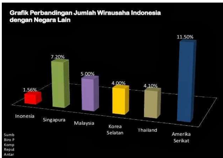
Gambar 1. Grafik Perbandingan Jumlah Wirausaha Indonesia dengan Negara Lain

bangsa atau mungkin ibu-ibu yang terdapat dalam satu wadah seperti organisasi, persatuan atau yayasan. Perhatian ini dapat berupa kepedulian terhadap pemberian pelatihan berkenaan hal tersebut diatas. Hal ini dapat berupa pemberian maupun pelatihan dan pendampingan pemanfaatan teknologinya.