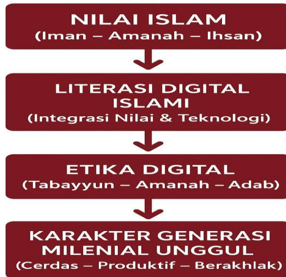
Gambar 1: Proses Pembentukan Etika Didital Islami

Kerangka konseptual kegiatan PKM ini dapat digambarkan sebagai berikut: