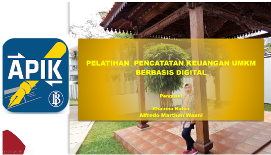
Gambar 1. Tampilan Depan Slide Pelatihan

Slide seperti yang diperlihatkan pada Gambar 1. merupakan informasi deskripsi umum kegiatan PKM yang dilaksanakan, dan juga penjelasan materi yang disampaikan selama pelatihan.