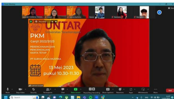
FOTO KEGIATAN PKM

Berdasarkan diskusi dan tanya jawab dengan staff PT SMM tim penyuluh mendapatkan informasi berupa perencanaan pembelian aset tetap dilakukan atas persetujuan pemilik perusahaan atau kepala produksi tanpa melalui bagian keuangan. Bagian yang bertanggung jawab melakukan pembelian aset tetap adalah bagian pembelian. Perusahaan melakukan pembelian atas mesin baru maupun mesin second. Keputusan atas pembelian mesin baru dan mesin second yaitu tergantung dari kondisi fisik dan harga. Perusahaan menggunakan metode penyusutan garis lurus untuk harta tetapnya dengan tarif penyusutan 12,5% atau 8 tahun mengikuti ketentuan pajak.