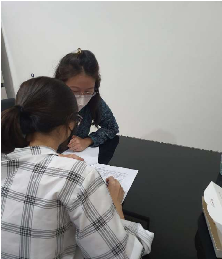
Gambar 4.1 Dokumentasi saat pelatihan luring

Berikut foto-foto selama PKM berlangsung: