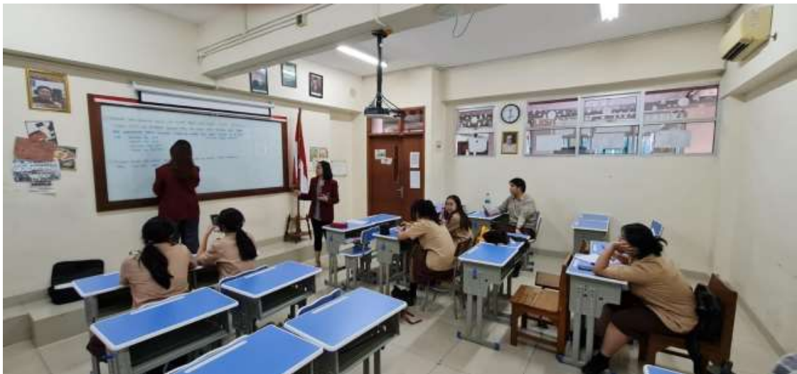
Gambar 4.1 Suasana kegiatan PKM

Kegiatan pelatihan oleh tim PKM kami di SMA St. Tarsisius I berjalan selama 90 menit pada Rabu, 18 Oktober 2023 dimulai pada pukul 14.30 dan berakhir pada 16.00 WIB. Tahapan pelatihan ini diawali dengan menyiapkan bahan-bahan pelatihan serta soal-soal persiapan untuk dibahas Bersama dengan siswa SMA St. Tarsisius I. Setelah melakukan persiapan awal, tim PKM kami akan memaparkan materi teori dilanjutkan dengan pembahasan contoh soal agar siswa SMA St.