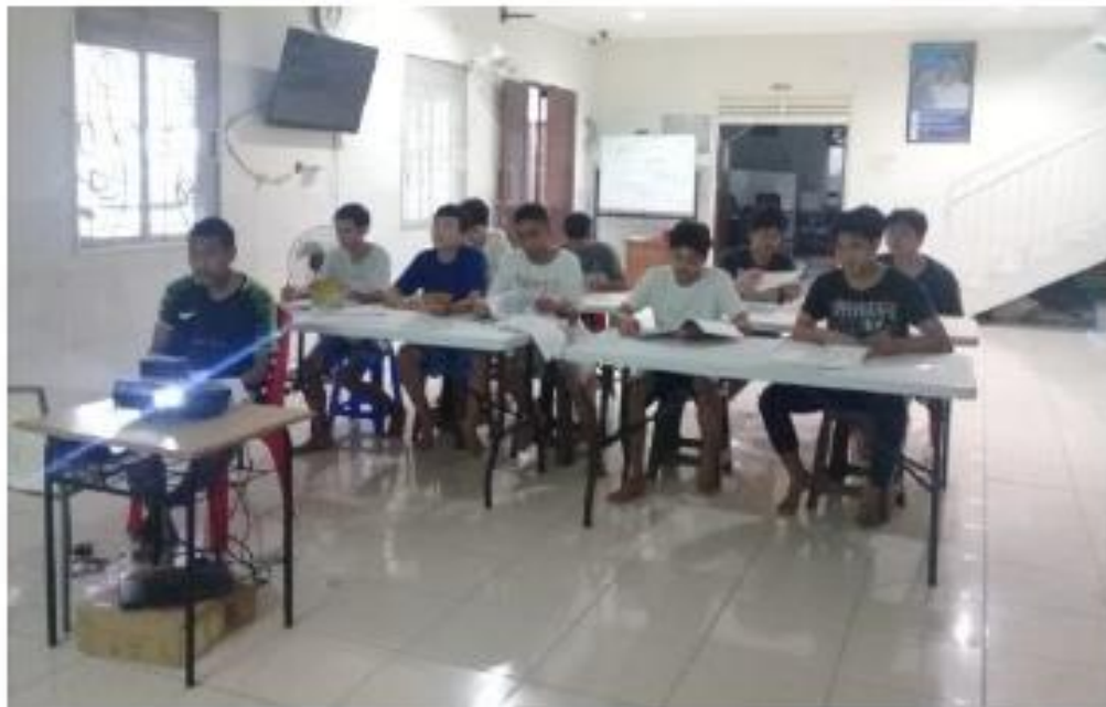
Gambar 2. Foto Peserta Saat Pelaksanaan Kegiatan PKM