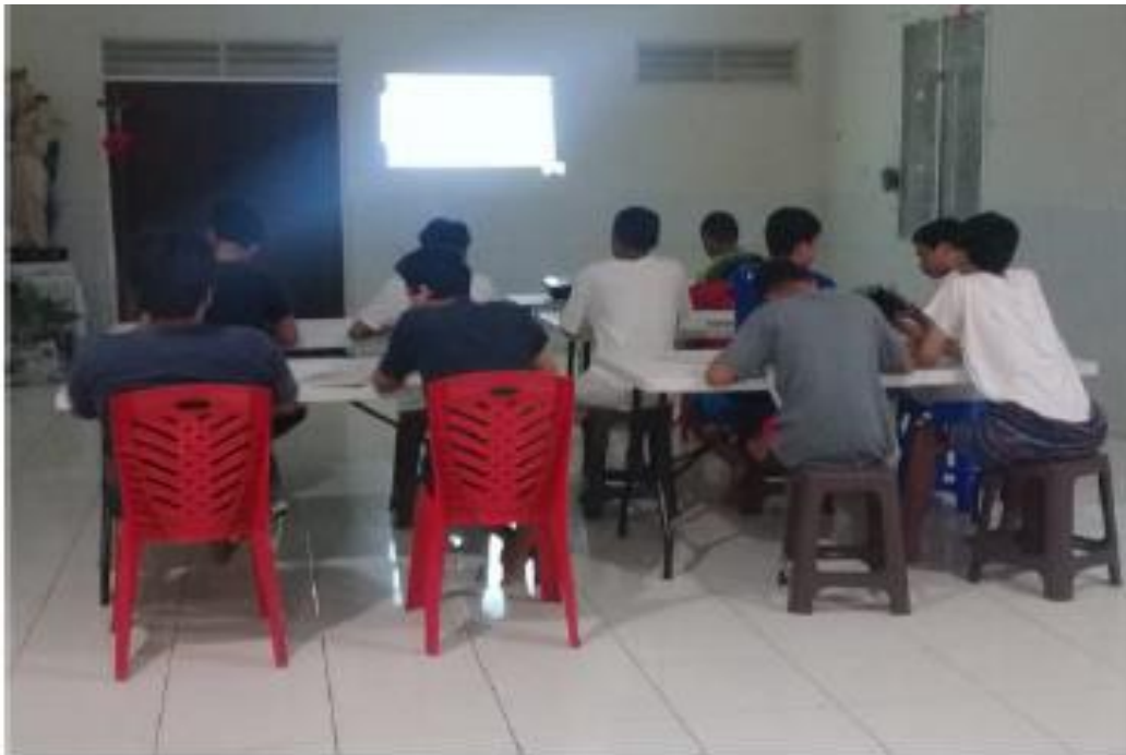
Gambar 3. Foto Peserta Memperhatikan Video Pelatihan Saat Pelaksanaan Kegiatan PKM