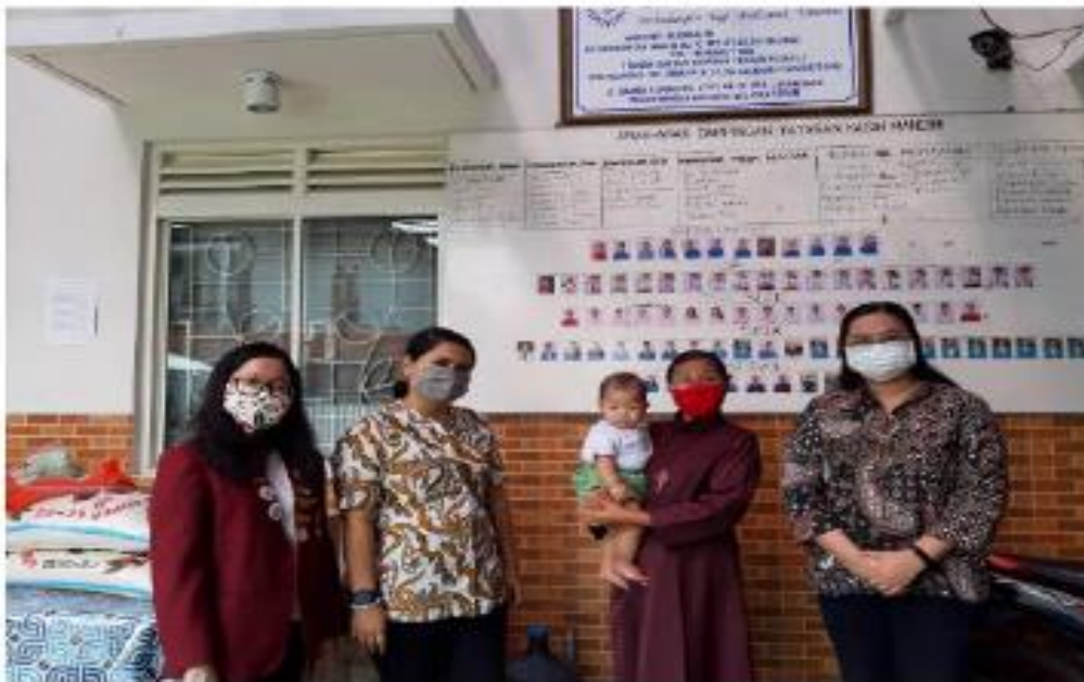
Gambar 4. Foto Tim PKM (Dosen dan Mahasiswa) dan Pengurus Yayasan