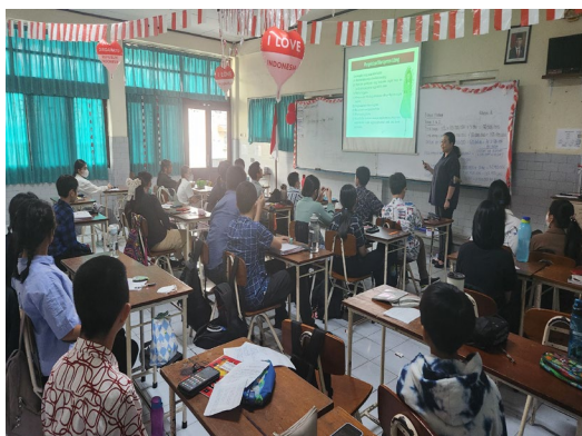
Foto pelaksanaan PKM edukasi dan pelatihan terkait utang usaha pada perusahaan dagang di SMP Ricci I Jakarta Barat (tanggal 29 Agustus 2024):