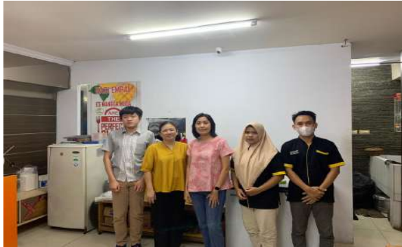
Gambar 1 Dosen & Mahasiswa berfoto bersama Pemilik dan Karyawan

yang dilanjutkan dengan latihan soal dalam menyusun laporan laba rugi. Dijelaskan juga bahwa transaksi penjualan yang terjadi dan sudah dicatat akan dimasukkan ke dalam buku penjualan, begitu juga dengan buku pembelian. Semua transaksi keuangan baik penerimaan maupun pengeluaran kas harus secara rutin dicatat dalam jurnal.