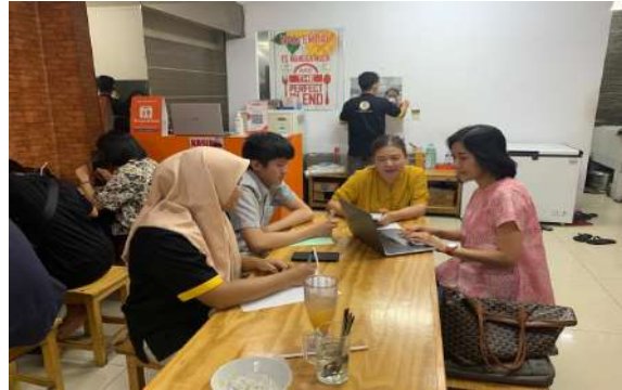
Gambar 2 Dosen FEB Untar sedang memberikan pelatihan kepada peserta