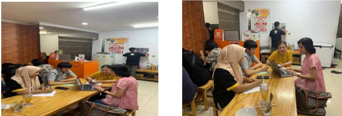
Gambar 1 Para peserta sedang mengikuti pelatihan yang diberikan oleh Dosen

Kegiatan PKM yang telah dilakukan telah didokumentasikan dalam foto berikut: