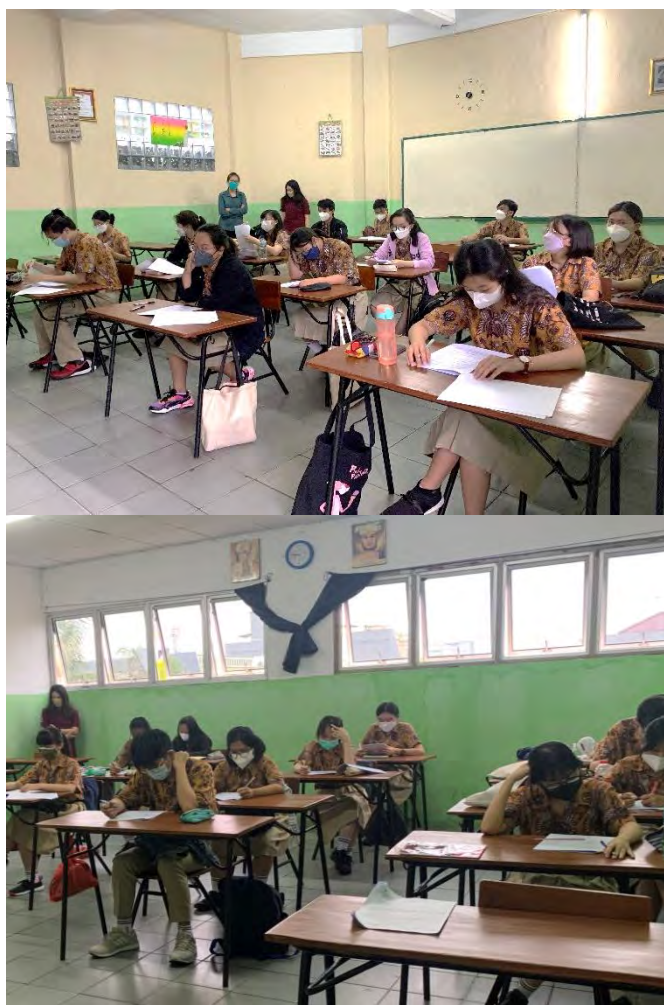
Gambar 3. Pelatihan diadakan secara luring bagi kelas XII IPA dan IPS