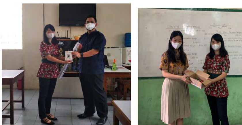
Gambar 2. Penyerahan Souvenir kepada sekolah dan siswa/i Kristen Yusef