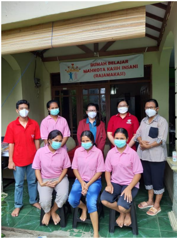
Gambar 3. Foto Bersama Tim Pelaksana PKM, Pengurus dan Peserta dari Yayasan Mahkota Kasih Insani