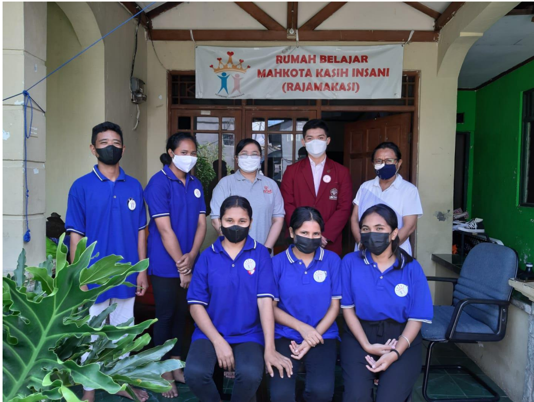
Gambar 3. Foto Bersama Tim Pelaksana PKM, Pengurus dan Peserta dari Rumah Belajar Mahkota Kasih Insani