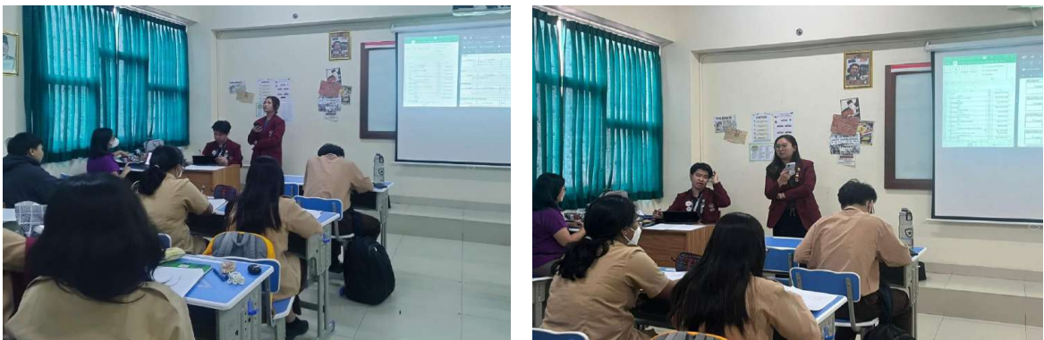
Gambar 4.3 Tim Mahasiswa Membahas Latihan Soal Buku Besar