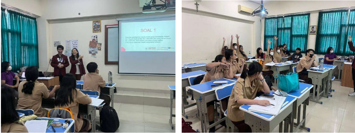
Gambar 4.4 Suasana Kuis Buku Besar dan Neraca Saldo

dengan benar. Keempat peserta yang benar mendapatkan hadiah berupa e-money @ Rp50.000. Gambar 4.4 menunjukkan suasana saat kuis sedang berlangsung.