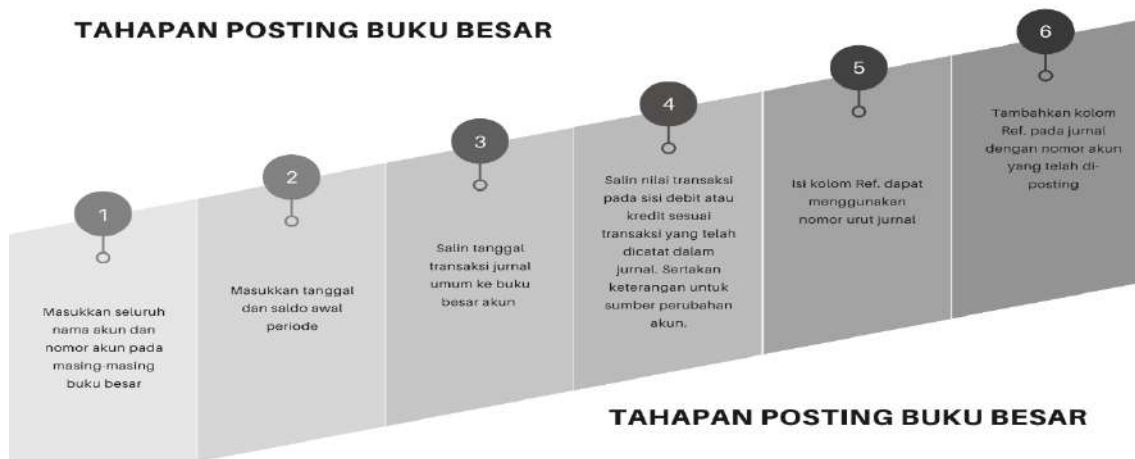
Gambar 4.2 Tahapan Posting ke Buku Besar

Buku Besar dibuat setelah membuat Jurnal Umum. Akun-akun yang ada pada Jurnal Umum akan di- posting ke Buku Besar. Peserta mendapatkan penjelasan mengenai tahapan posting Buku Besar, seperti pada Gambar 4.2 dan mem- posting akun dari Jurnal Umum ke Buku Besar menggunakan template yang telah diberikan oleh tim pengajar. Gambar 4.3 memperlihatkan suasana saat tim mahasiswa membahas latihan soal Buku Besar.