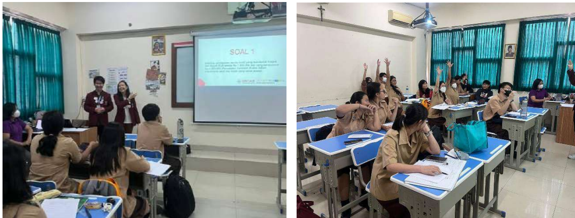
Suasana Kuis Buku Besar dan Neraca Saldo

Setelah melakukan pendalaman materi, membahas contoh soal, dan kuis, selanjutnya Kuesioner 2 akan diberikan kepada siswa/I pada akhir kegiatan. Kuesioner 2 dibagikan dengan tujuan agar melihat bagaimana tanggapan siswa/I terkait kegiatan dan seberapa jauh pemahaman mengenai penyajian Buku Besar dan Neraca Saldo setelah kegiatan dilakukan. Berikut keterangan mengenai Kuesioner 2: