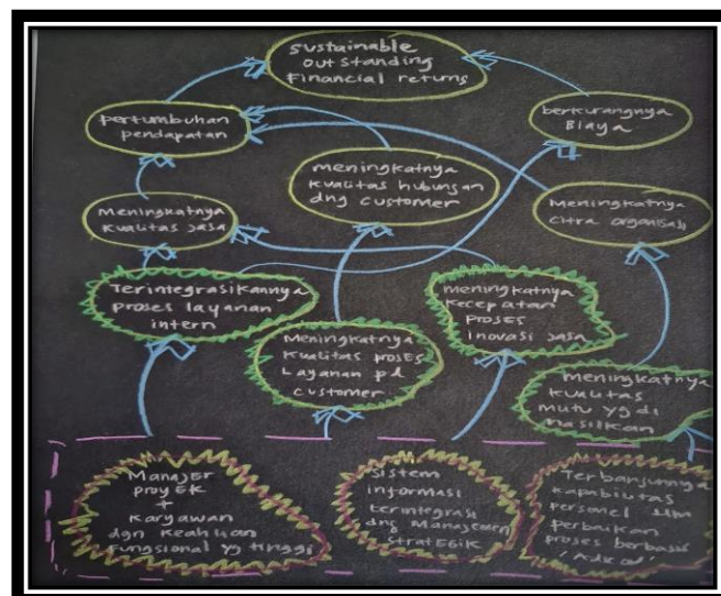
Gambar 4. Model Konseptual Awal

Pada langkah ini akan dibuat bentuk konseptual awal yang secara general dapat digambarkan sebagai berikut :