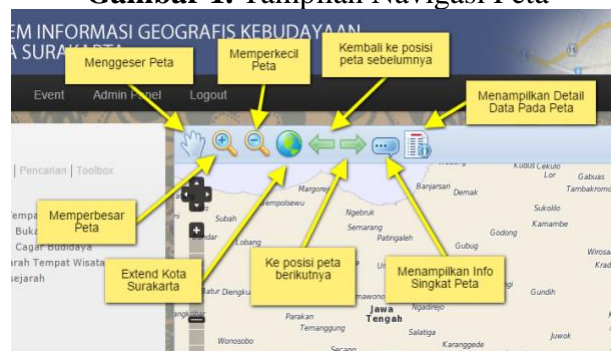
Gambar 1. Tampilan Navigasi Peta

Ketentuan Gambar. Gambar diletakkan di tengah halaman. Keterangan gambar ( caption ) diletakkan di atas gambar, dengan tipe times new roman, 12 poin, spasi 1. Sumber gambar dituliskan dibagian bawah gambar dengan posisi rata kiri sejajar gambar. Untuk bagan atau tabel yang tidak menggunakan smart art , harus di grouping terlebih dahulu (misalnya bagan struktur organisasi).