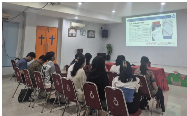
Peserta mencoba membuat SMART Goals

Selama kegiatan berlangsung, peserta menunjukkan keterlibatan aktif, terutama dalam sesi diskusi studi kasus dan refleksi. Pada sesi penyusunan SMART Goals , seluruh peserta berhasil menyusun satu tujuan belajar pribadi. Sebanyak 9 peserta secara sukarela membagikan hasilnya di sesi berbagi. Tujuan yang mereka susun umumnya mencakup area belajar yang nyata, seperti “meningkatkan nilai ulangan matematika dengan belajar 30 menit setiap malam selama dua minggu.” Refleksi lisan yang dikumpulkan dalam sesi tanya jawab juga menunjukkan pergeseran cara pandang terhadap proses belajar. Beberapa peserta menyatakan bahwa mereka “tidak lagi terlalu takut gagal karena tahu apa yang harus dilakukan setelahnya,” serta “lebih paham arah belajar saya sendiri.”