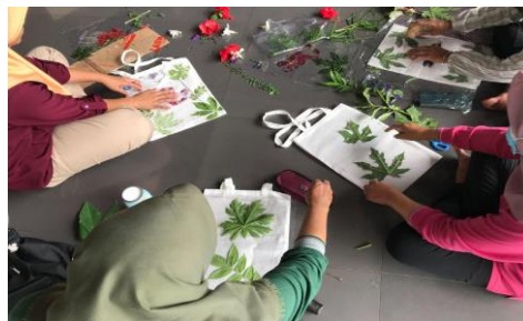
Gambar 3. Partisipan Melakukan Kegiatan Seni Ecoprint

Meskipun demikian, temuan ini belum menunjukkan perubahan signifikan secara statistik. Hal ini kemungkinan disebabkan oleh beberapa faktor teknis dan situasional selama pelaksanaan program, seperti keterbatasan partisipan, keterbatasan waktu pelaksanaan, serta sarana dan prasarana di lokasi pelaksanaan. Contohnya, ada momen-momen tertentu dimana tim dan partisipan tidak dapat melaksanakan kegiatan dalam kondisi sepenuhnya tenang dan fokus karena distraksi dari lingkungan sekitar, disebabkan oleh tempat yang digunakan untuk melaksanakan program merupakan ruang terbuka serbaguna. Lalu, terbatasnya alat yang tersedia untuk penerapan metode tempel dan pukul ( pounding technique ) pada kegiatan Seni Ecoprint , membuat partisipan tidak dapat melakukan eksplorasi secara maksimal dalam proses kreatifnya. Kendati begitu, keterbatasan tersebut tidak serta-merta menghilangkan dampak positif dari kegiatan Seni Ecoprint . Justru, melalui kondisi tersebutlah tim dapat melakukan observasi yang lebih mendalam terhadap dinamika perilaku setiap partisipan.