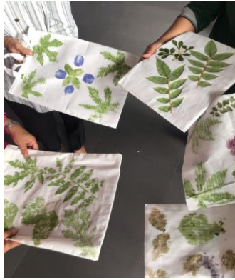
Gambar 2. Hasil Kegiatan Seni Ecoprint Partisipan