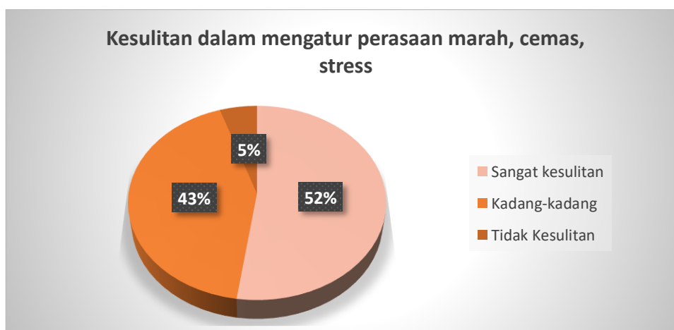
Gambar 3 Kesulitan Mengelola Emosi.

Dari data yang diperoleh bahwa 52,3% kesulitan dalam mengatur perasaan marah, cemas, stress, 42,6% kadang-kadang kesulitan dalam mengatur perasaan marah, cemas, stress, kemudian sisanya di peroleh 5,1% tidak kesulitan dalam mengatur emosi pada remaja perempuan. Hasil data bisa dilihat dari diagram dibawah ini.