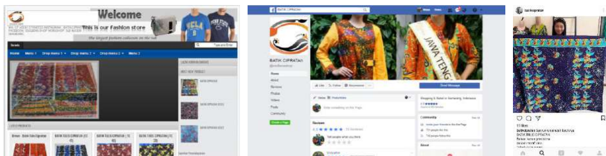
Gambar 2. Situs, akun facebook dan akun Instagram SLB Negeri Semarang

Berdasarkan hasil analisis SLB Negeri Semarang telah memiliki kelengkapan komponen penjualan dan beberapa media sosial yang dibutuhkan dalam proses promosi diantaranya yaitu : 1) situs atau website , 2) akun Facebook dan 3) akun Instagram. Gambar 2 menampilkan halaman media online tersebut.