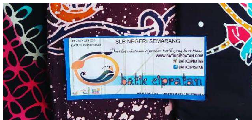
Gambar 1. Media promosi produk Batik Cipratan

Tujuan untuk kemandirian dan produktivitas siswa yang menjadi bekal dalam kehidupannya setelah selesai masa sekolah menjadi latar belakang dari dibuatnya aktivitas pembuatan Batik Cipratan ini. Keinginan dan semangat para siswa untuk dapat melanjutkan kehidupan dengan kekuatan sendiri menjadi kekuatan SLB Negeri Semarang untuk melaksanakan program ekstra-kurikuler ini. Para siswa ingin menunjukkan bahwa dengan keterbatasan, mereka mampu menghasilkan sesuatu yang bernilai ekonomi tinggi sehingga nanti bisa menopang kehidupannya. Hal ini ditunjukkan dengan penjualan Batik Cipratan yang cukup banyak. Para peminat batik ini membeli bukan karena faktor 'kasihan', namun memang karena kualitas dan kreativitas motif yang dihasilkan. Saat ini karya batik para siswa SLB Negeri Semarang semakin banyak diminati, tidak hanya masyarakat Jawa Tengah, bahkan wisatawan Brunei Darusalam dan Eropa. Ini menjadi salah satu bukti bahwa keberadaan karya Batik Cipratan dari siswa SLB Negeri Semarang memiliki kualitas dan daya saing cukup tinggi.