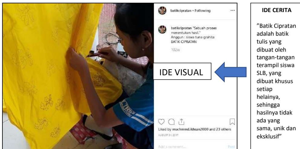
Gambar 7. Ide Cerita dan Ide Visual

Para peserta diberi kesempatan untuk mengeluarkan gagasan terkait ide visual dan juga ide cerita yang akan digunakan. Contoh ide cerita:” Batik Cipratan adalah batik tulis yang dibuat oleh tangan-tangan terampil siswa SLB, yang dibuat khusus setiap helainya, sehingga hasilnya tidak ada yang sama, unik dan eksklusif. Hal ini dapat divisualisasikan dengan memberikan visual siswa yang sedang melakukan kegiatan membatik, seperti pada Gambar 7.