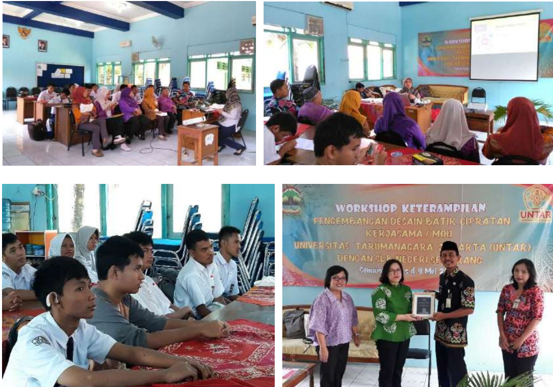
Gambar 6. Foto suasana pelatihan

Para peserta diberi kesempatan untuk mengeluarkan gagasan terkait ide visual dan juga ide cerita yang akan digunakan. Contoh ide cerita:” Batik Cipratan adalah batik tulis yang dibuat oleh tangan-tangan terampil siswa SLB, yang dibuat khusus setiap helainya, sehingga hasilnya tidak ada yang sama, unik dan eksklusif. Hal ini dapat divisualisasikan dengan memberikan visual siswa yang sedang melakukan kegiatan membatik, seperti pada Gambar 7.