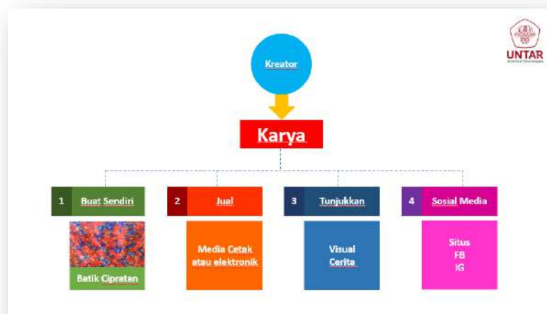
Gambar 3. Alur pembuatan promosi melalui media online

Berdasarkan hasil analisis, SLB Negeri Semarang membutuhkan pembuatan situs dan media sosial, karena sebelumnya telah ada. Hal yang dibutuhkan adalah bagaimana mengelola dan membuat perencanaan dalam menggunakan media tersebut. Penggunaan media cetak konvensional saat ini membutuhkan lebih banyak biaya, dengan tingkat sebaran yang tidak seluas media online . Berdasarkan data tersebut maka langkah yang bisa dilakukan dalam promosi Batik Cipratan dapat dilihat pada Gambar 3.