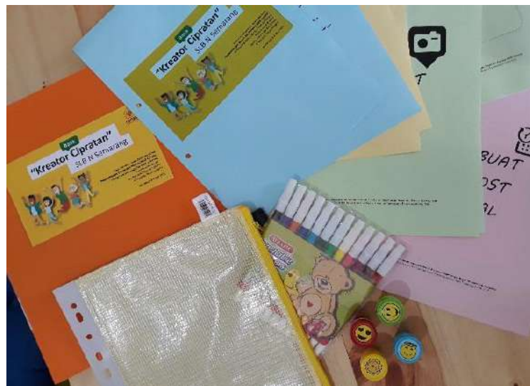
Gambar 5. Buku kerja perencanaan promosi