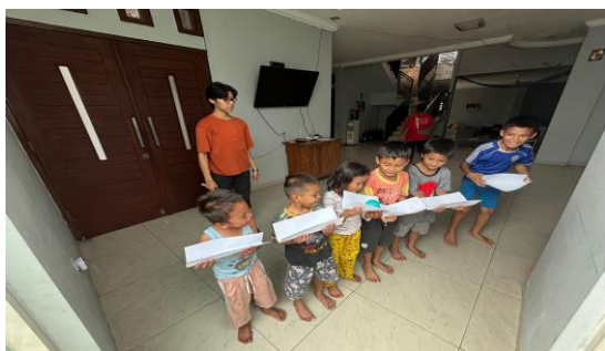
Gambar 2. Pelaksanaan Play Activities Estafet Bola

anak-anak semakin kompak dan sabar dalam menunggu giliran dan mau membantu teman yang lain. Beberapa kali, terdapat anak yang marah dan kesal dengan temannya, namun dari hasil pengamatan pada minggu kelima telah banyak perkembangan pada perilaku anak-anak.