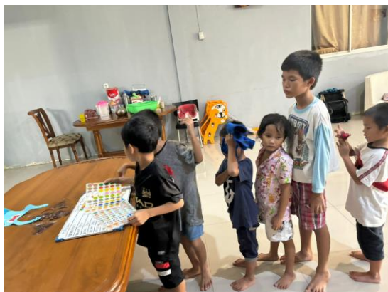
Gambar 4. Pengisian token economy sebagai reward