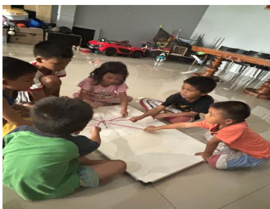
Gambar 3. Pelaksanaan Play Activities Spidol Gurita