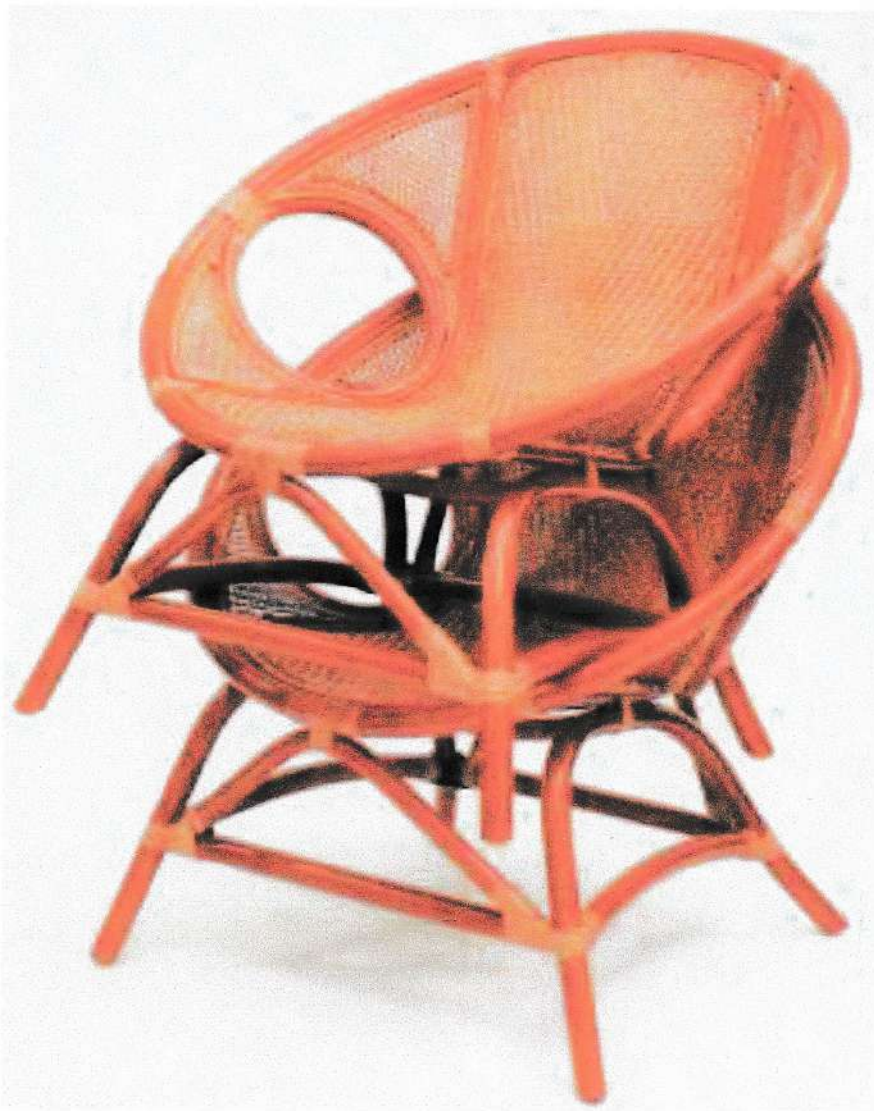
Gambar 7: sistem susun