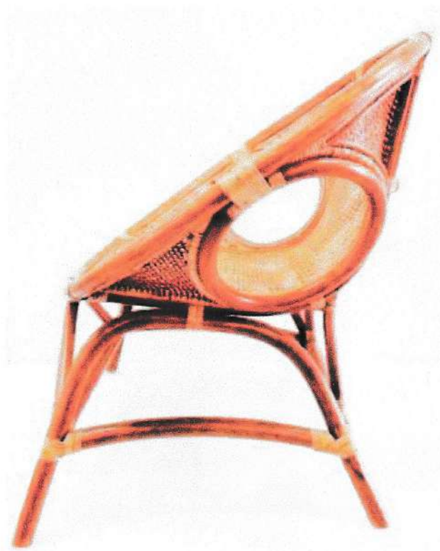
Gambar 3 : Tampak Samping