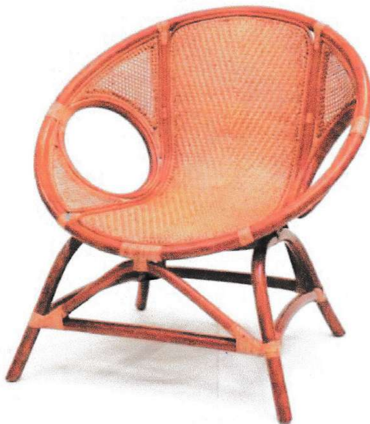
Gambar 6: Tampak Perspektif