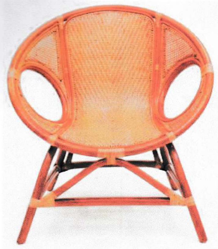
Gambar 1: Tampak Depan