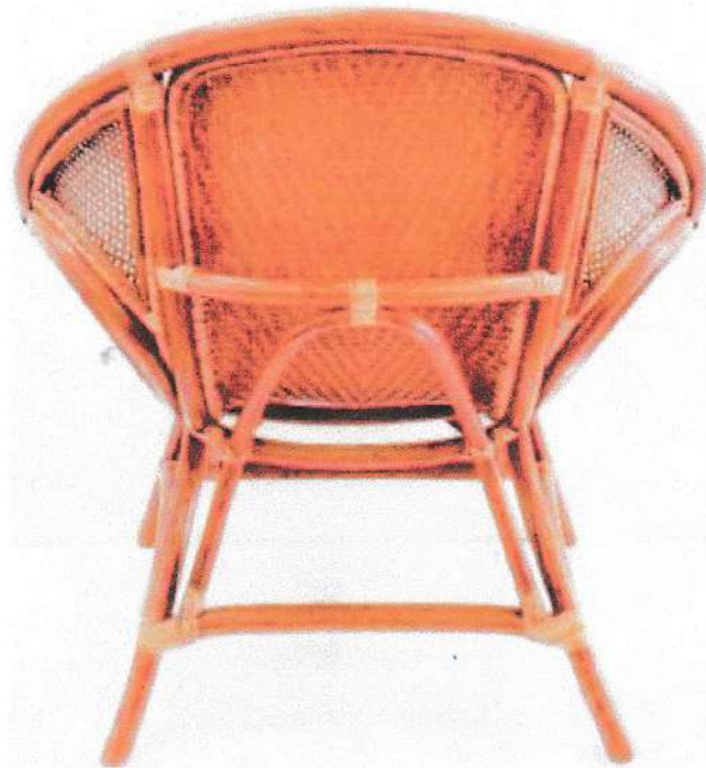
Gambar 2 : Tampak Belakang