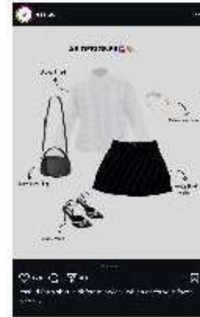
Gambar 3. Feeds Essi

Konten ini menggunakan visual bergaya “struk belanja” untuk mempromosikan produk Liam Denim Pants , dikemas dalam desain minimalis monokrom. Gaya bahasa yang santai, personal, dan ringan mencerminkan tone yang sesuai dengan karakter Gen Z dan milenial muda.