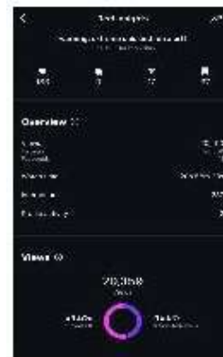
Gambar 5. Insight Konten Reels Event Offline Campaign

Tipe konten kedua yang digunakan Essi adalah event offline campaign , biasanya berbentuk video reels yang kreatif dan informatif. Konten ini bertujuan untuk memperlihatkan keaktifan brand dalam ekosistem nyata, seperti bazaar fashion hal yang efektif membangun kepercayaan dan koneksi emosional dengan audiens. Berdasarkan dua reels campaign kolaboratif yang telah di unggah, terlihat performa yang luar biasa. Pertama, konten yang di unggah pada tanggal 12 Juni 2025 dalam bazaar Slowmove berhasil meraih 20.359 views, dengan watch time total 20 jam 58 menit dan 237 interaksi termasuk 17 shares dan 37 saves , di mana 45,5% dari penonton adalah non-followers. Reels campaign kedua dengan USS Yard Sale 2025 bahkan mencapai 73.294 views, 309 likes, 51 saves , dan 17 shares . Persentase reach tinggi dari non-followers menegaskan bahwa strategi kolaborasi mampu menjangkau audiens baru yang relevan dan memperluas awareness secara organik.