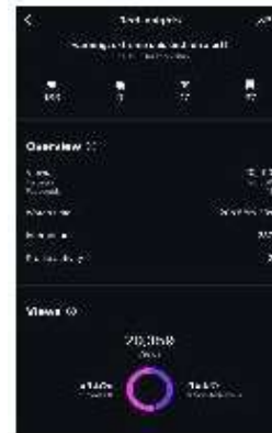
Gambar 5. Insight Konten Reels Event Offline Campaign

Tipe konten kedua yang digunakan Essi adalah event offline campaign , biasanya berbentuk video reels yang kreatif dan informatif. Konten ini bertujuan untuk memperlihatkan keaktifan brand dalam ekosistem nyata, seperti bazaar fashion hal yang efektif membangun kepercayaan dan koneksi emosional dengan audiens. Berdasarkan dua reels campaign kolaboratif yang telah di unggah, terlihat performa yang luar biasa. Pertama, konten yang di unggah pada tanggal 12 Juni 2025 dalam bazaar Slowmove berhasil meraih 20.359 views, dengan watch time total 20 jam 58 menit dan 237 interaksi termasuk 17 shares dan 37 saves , di mana 45,5% dari penonton adalah non-followers. Reels campaign kedua dengan USS Yard Sale 2025 bahkan mencapai 73.294 views, 309 likes, 51 saves , dan 17 shares . Persentase reach tinggi dari non-followers menegaskan bahwa strategi kolaborasi mampu menjangkau audiens baru yang relevan dan memperluas awareness secara organik.