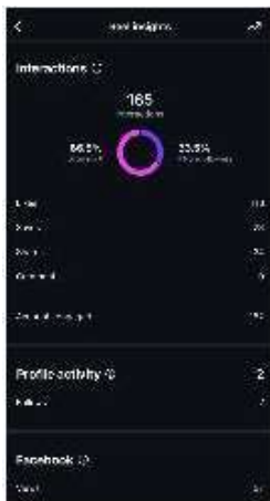
Gambar 10. Insight konten A Day in Our Life

Dari sisi performa, konten ini mendapatkan total 165 interaksi, dengan 66,5% diantaranya berasal dari followers dan 33,5% dari non-followers . Interaksi tersebut terdiri dari 113 likes, 28 saves, dan 24 shares, meskipun belum terdapat komentar. Tingginya jumlah simpanan dan share menunjukkan bahwa konten ini dianggap menarik dan relevan untuk dibagikan maupun disimpan sebagai referensi. Menurut penelitian oleh Phua et al. (2020), konten ini berhasil menjangkau 152 akun dan menghasilkan dua followers baru. Hal ini menunjukkan bahwa meskipun jangkauannya belum terlalu luas, konten ini tetap memberikan dampak positif terhadap pertumbuhan akun. Secara keseluruhan, pendekatan yang mengkombinasikan storytelling dan tren yang sedang berlangsung, sehingga menarik perhatian audiens.