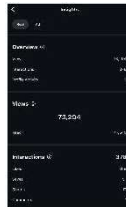
Gambar 6. Insight Konten Reels Event Offline Campaign 2