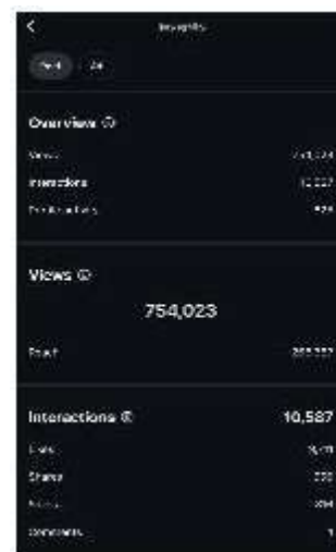
Gambar 7. Insight Konten Tips And Tricks

menyebarkan pesan edukatif ini ke audiens yang lebih luas. Menurut Handayani & Firmansyah (2020), konten yang menyampaikan nilai informatif atau edukatif memiliki kecenderungan lebih tinggi untuk meningkatkan brand trust dan memperkuat hubungan emosional antara brand dengan audiensnya. Dengan melihat tingginya angka likes (9.711), saves (316), dan shares (556), serta tingginya jumlah view dari non-followers, dapat disimpulkan bahwa konten edukatif ini berhasil menggabungkan elemen value , visual menarik, dan strategi distribusi yang tepat sehingga menghasilkan engagement yang tinggi dan berkontribusi besar dalam membangun brand awareness .