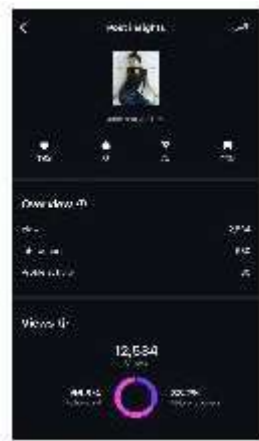
Gambar 4. Insight Konten Feeds Produk Essi

mengandung pesan-pesan persuasif. Dalam salah satu postingan produk pada tanggal 4 Juni, misalnya, tampak bahwa penyampaian konten tidak hanya bertujuan untuk memperkenalkan koleksi baru, tetapi juga mengajak audiens untuk memahami keunggulan produk melalui narasi yang ditulis dengan gaya copywriting yang halus. Penyajian konten dalam bentuk slide memberi kesempatan bagi audiens untuk berinteraksi lebih lama dengan konten, karena mendorong mereka untuk melakukan swipe dan mengeksplorasi informasi lebih lanjut.