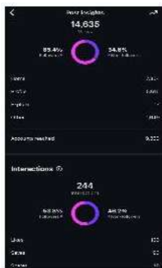
Gambar 8. Insight Konten Testimoni Dan Repost.

Salah satu konten dengan format repost ini memperoleh 14.635 views dengan total 244 interaksi. Sebanyak 65,4% dari viewers adalah followers, dan 34,6% merupakan non-followers, yang menunjukkan bahwa konten ini tetap mampu menjangkau audiens baru meskipun tidak se-viral tipe konten edukatif atau kolaboratif. Interaksi tertinggi berasal dari likes 133 dan saves 93, yang menunjukkan bahwa konten ini dianggap menarik atau inspiratif untuk disimpan oleh audiens. Meskipun insight dari konten ini secara metrik tidak setinggi konten edukatif atau humor, konsistensi dalam mengunggah repost menciptakan efek jangka panjang berupa loyalitas dan keterlibatan emosional dengan brand. Konten ini juga memperluas potensi jangkauan, karena pelanggan yang direpost cenderung akan membagikan kembali kontennya, sehingga menjangkau audiens baru secara organik.