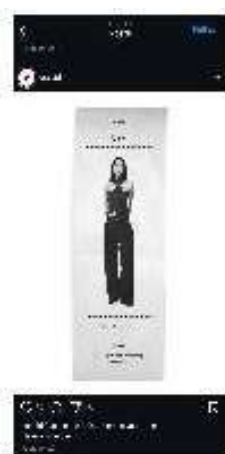
Gambar 2. Caption Feeds “Receipt Style” Essi

Gaya bahasa yang digunakan bersifat non-formal namun tetap sopan dan relevan dengan konteks kehidupan audiens. Dalam praktiknya, konten Essi menggunakan kombinasi bahasa Indonesia dan bahasa Inggris, mencerminkan gaya komunikasi generasi muda urban yang terbiasa berinteraksi di platform digital secara bilingual. Hal ini sejalan dengan temuan bahwa generasi Z cenderung lebih responsif terhadap brand yang mampu menyampaikan pesan secara autentik dan menarik dalam format yang mereka anggap relevan (Fromm & Read, 2018).