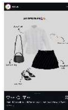
Gambar 3. Feeds Essi

Konten ini menggunakan visual bergaya “struk belanja” untuk mempromosikan produk Liam Denim Pants , dikemas dalam desain minimalis monokrom. Gaya bahasa yang santai, personal, dan ringan mencerminkan tone yang sesuai dengan karakter Gen Z dan milenial muda.