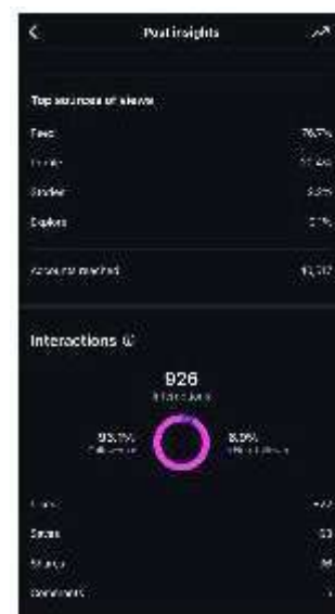
Gambar 9. Insight Konten Meme

Konten ini juga mencatatkan total 926 interaksi, yang menunjukkan respons positif dari audiens terhadap jenis konten ini. Mayoritas interaksi datang dari followers (93,1%), sedangkan interaksi dari non-followers berada di angka 6,9%. Rincian interaksi terdiri atas 822 likes, 63 saves, 36 shares, dan 5 komentar. Data ini memperlihatkan bahwa meskipun jumlah komentar tergolong rendah, namun angka like dan save yang tinggi menandakan bahwa konten ini cukup menghibur sekaligus dianggap layak disimpan. Dari sisi distribusi tayangan, sebagian besar datang dari feed (76,7%), diikuti oleh tampilan dari profil (20,4%), stories (2,2%), dan explore (0,1%). Hal ini menunjukkan bahwa meskipun konten belum banyak tersebar secara organik melalui halaman eksplorasi, tetapi tetap tampil kuat di halaman utama audiens. Dengan gaya penyampaian yang ringan dan lucu, konten ini berfungsi sebagai "ice breaker" di antara deretan konten edukatif dan promosi. Strategi ini penting untuk menjaga keberagaman konten dan membuat audiens merasa lebih dekat dengan brand secara personal.