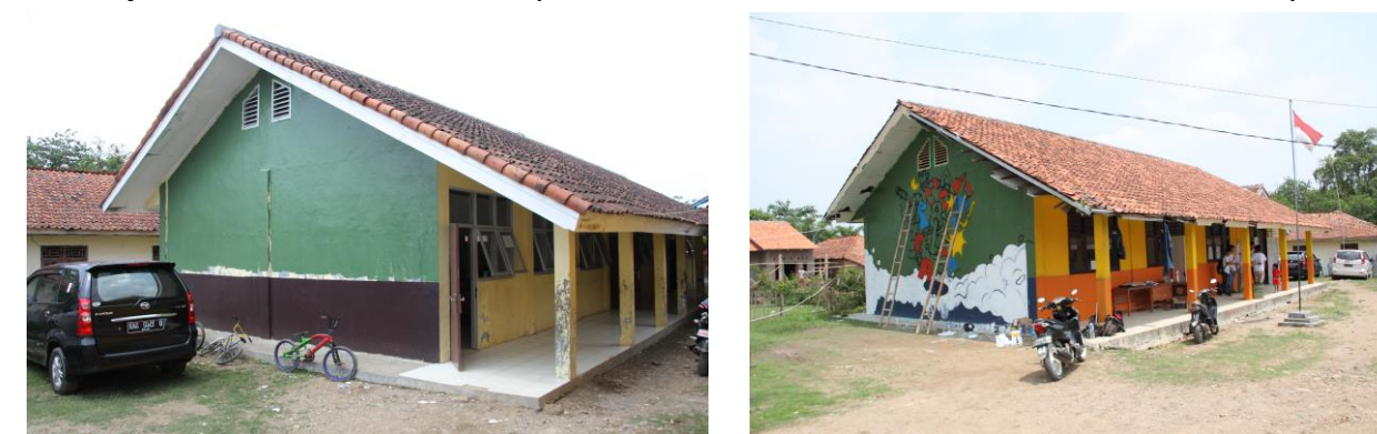
Gambar 2: Dinding Sekolah di Mural

Mural merupakan seni lukis yang diaplikasikan pada dinding atau permukaan besar lainnya, yang tidak hanya berfungsi sebagai hiasan, tetapi juga sebagai media penyampaian pesan moral dan budaya. Mural dapat menjadi sarana untuk menghias dinding-dinding lusuh, mengubahnya menjadi ruang yang lebih hidup dan bermakna (Kholilah, Naufa, & Ghifari, 2022).