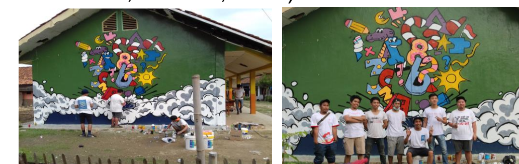
Gambar 5: Karya Mural di SDN Babakan Raden 01 Cariu Bogor – Jawa Barat

Mural sebagai sarana pendidikan di sekolah-sekolah, memang disarankan agar para murid atau peserta didik ketika melihat lukisan dinding yang dibuat, selain menjadi 'terhibur', sekaligus mendapatkan pesan-pesan dari lukisan dinding atau mural yang dilihatnya. Kreasi membuat mural di lingkungan sekolah, tidak hanya memikirkan unsur estetikanya saja, melainkan, dan yang utama adalah kandungan-kandungan pesan yang ingin disampaikan kepada peserta didik melalui mural (Arsyad, Wahyudi, Nurfadilah, & Lewa, 2023).