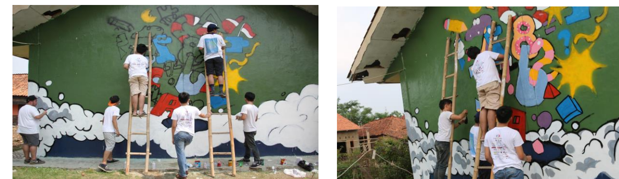
Gambar 3: Membuat Mural Menerapkan Angka dan Huruf

Proses pembuatan mural juga dapat diintegrasikan ke dalam metode belajar di sekolah-sekolah. Melalui proyek mural, siswa dapat belajar tentang seni, kolaborasi, dan tanggung jawab sosial.