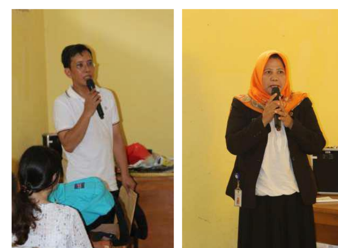
Gambar 1: Sambutan

Sebagai lembaga pendidikan dasar, SDN Babakan Raden 01 Cariu mempunyai visi dan misi yang jelas. Visi sekolah adalah menciptakan generasi muda yang berkarakter, cerdas, dan kreatif. Misi diimplementasikan melalui program pembelajaran yang tidak hanya mengutamakan aspek kognitif, tetapi juga aspek afektif dan psikomotorik. Hal ini sangat penting dalam membentuk kepribadian siswa yang holistik, di mana mereka tidak hanya menjadi individu yang pintar, tetapi juga memiliki nilai-nilai moral yang baik serta kemampuan berkreasi.