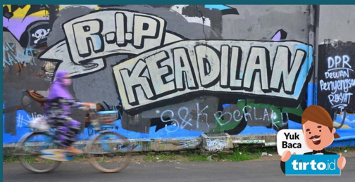
gambar salah satu contoh bentuk ekspresi pada grafiti di tempat umum

Grafiti adalah seni lukis atau tulisan yang biasanya diterapkan pada dinding atau permukaan publik lainnya secara ilegal atau tanpa izin. Grafiti bisa mencakup berbagai bentuk ekspresi artistik, termasuk gambar, tulisan, atau kombinasi keduanya. Meskipun banyak grafiti dianggap sebagai bentuk seni jalanan yang kreatif dan menghibur, beberapa di antaranya juga dianggap sebagai vandalisme karena sering kali dilakukan tanpa izin pemilik properti. Grafiti telah menjadi bagian dari budaya perkotaan dan dapat mencerminkan berbagai pesan politik, sosial, atau budaya. Beberapa seniman grafiti terkenal telah berhasil membawa seni jalanan ke level yang lebih dihargai dan diakui di dunia seni kontemporer. Meskipun grafiti memiliki reputasi sebagai bentuk seni kontroversial, banyak orang melihatnya sebagai medium yang kuat untuk menyampaikan pesan dan mengekspresikan kreativitas.