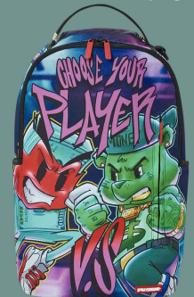
Contoh Kemasan dan Produk yang Berkarakter Unsur Grafiti

https://www.businessinsider.com/monster-beverages-new-alcoholic-energy-drinks-2023-3 https://www.sprayground.com/products/choose-your-player-backpack?variant=44656764256443