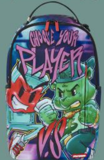
Contoh Kemasan dan Produk yang Berkarakter Unsur Grafiti