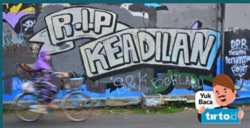
gambar salah satu contoh bentuk ekspresi pada grafiti di tempat umum

Grafiti adalah seni lukis atau tulisan yang biasanya diterapkan pada dinding atau permukaan publik lainnya secara ilegal atau tanpa izin. Grafiti bisa mencakup berbagai bentuk ekspresi artistik, termasuk gambar, tulisan, atau kombinasi keduanya. Meskipun banyak grafiti dianggap sebagai bentuk seni jalanan yang kreatif dan menghibur, beberapa di antaranya juga dianggap sebagai vandalisme karena sering kali dilakukan tanpa izin pemilik properti. Grafiti telah menjadi bagian dari budaya perkotaan dan dapat mencerminkan berbagai pesan politik, sosial, atau budaya. Beberapa seniman grafiti terkenal telah berhasil membawa seni jalanan ke level yang lebih dihargai dan diakui di dunia seni kontemporer. Meskipun grafiti memiliki reputasi sebagai bentuk seni kontroversial, banyak orang melihatnya sebagai medium yang kuat untuk menyampaikan pesan dan mengekspresikan kreativitas.