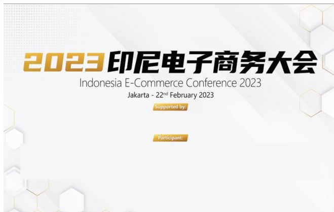
Photo App Backdrop 2023 Indonesian E-Commerce Conference

Wall screen display yang ditampilkan selain presentasi dari para presenter dan owner , juga terdapat welcome video , countdown video , intro video dan guest introduction .