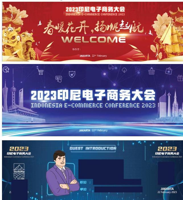
Wall Screen Display 2023 Indonesian E-Commerce Conference

X-Banner yang dipajang di depan booth berfungsi untuk mengenalkan jasa-jasa apa saja yang disediakan oleh PT. X. Sedangkan yang dipajang di depan ruangan presentasi berisi waktu dan nama presenter yang akan tampil.