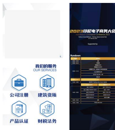
X-Banner 2023 Indonesian E-Commerce Conference