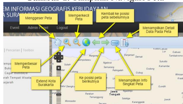
Gambar 1. Tampilan Navigasi Peta

Ketentuan Gambar. Gambar diletakkan di tengah halaman. Keterangan gambar ( caption ) diletakkan di atas gambar, dengan tipe times new roman, 12 poin, spasi 1. Sumber gambar dituliskan dibagian bawah gambar dengan posisi rata kiri sejajar gambar. Untuk bagan atau tabel yang tidak menggunakan smart art , harus di grouping terlebih dahulu (misalnya bagan struktur organisasi).