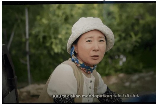
Gambar 1. Scene Serial Queen of Tears