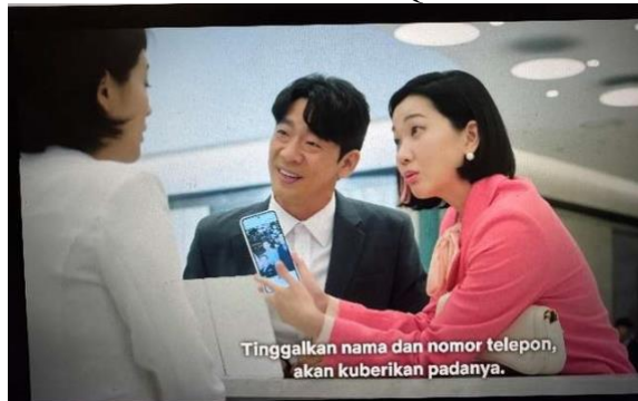
Gambar 5. Scene Serial Queen of Tears