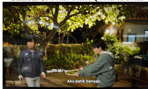
Gambar 3. Scene Serial Queen of Tears