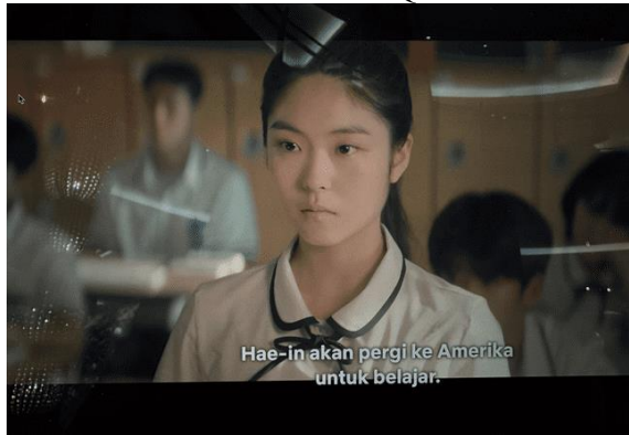
Gambar 4. Scene Serial Queen of Tears