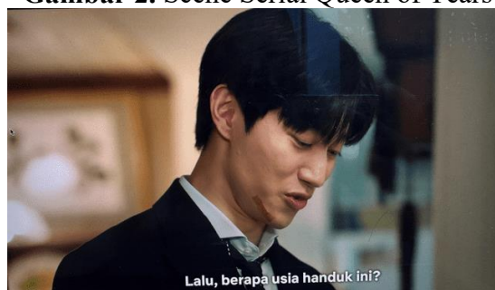
Gambar 2. Scene Serial Queen of Tears