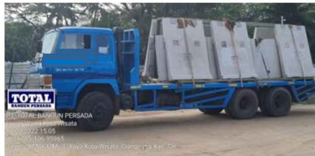
Gambar 10. Precast sampai di lokasi proyek

Setelah barang sampai di lokasi proyek (Gambar 10), beton precast yang telah dikirim diperiksa kembali akan ukuran, letak serta jumlah conduit dan juga plat besi untuk bagian dimana akan di las pada balok sebagai titik tumpu penahan Precast (Gambar 11).