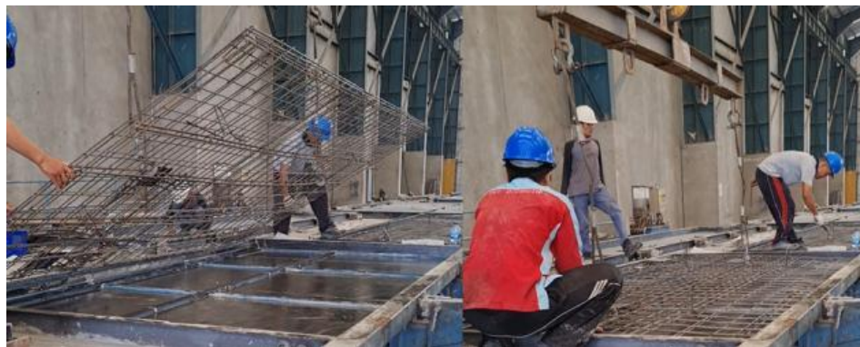
Gambar 3. Pemindahan tulangan precast ke cetakan dengan menggunakan crane