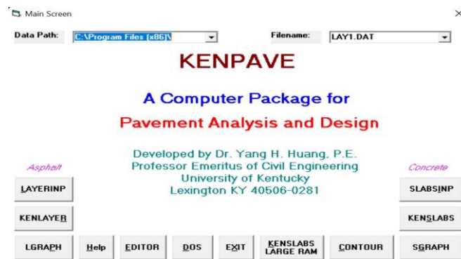
Gambar 2 Tampilan KENPAVE

Berikut merupakan tahapan analisis menggunakan struktur perkerasan lentur dalam menggunakan program KENPAVE dan menu tampilan utama dapat disajikan pada Gambar 2 berikut.