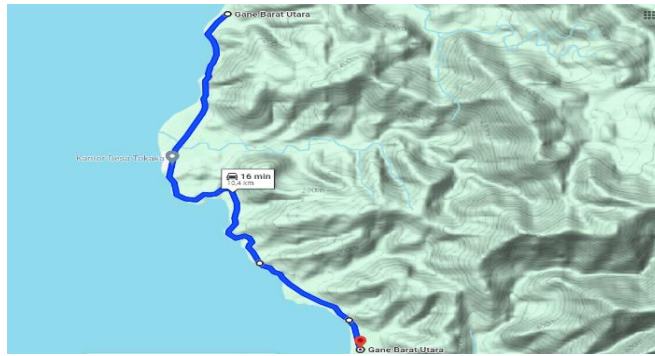
Gambar 1. Lokasi Penelitian

Sedangkan data parameter perkerasan lentur untuk analisis di diperoleh dari MDPJ 2017 dan suplemen MDPJ 2017 (2020). Sedangkan untuk CBR timbunan dan poisson ratio menggunakan data modulus elastisitas atau ditentukan sendiri sesuai persyaratan MDPJ 2017, Tahapan pada penelitian ini dibagi menjadi dua bagian. Bagian pertama melakukan perencanaan desain tebal perkerasan lentur menggunakan MDPJ 2017 dan yang ke dua melakukan analisis secara mekanistik empiris menggunakan program KENPAVE terhadap perkerasan lentur eksisting dan juga hasil dari perkerasan MDPJ 2017, adapun tahapan untuk perencanaan desain perkerasan lentur beracuan dari MDPJ 2017 adalah sebagai berikut: