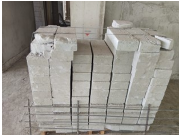
Gambar 3. Bata ringan yang rusak akibat pengangkatan