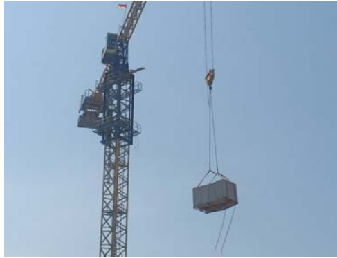
Gambar 1. Pengangkatan bata ringan dengan tower crane