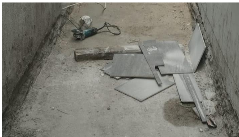
Gambar 2. Gambaran waste keramik