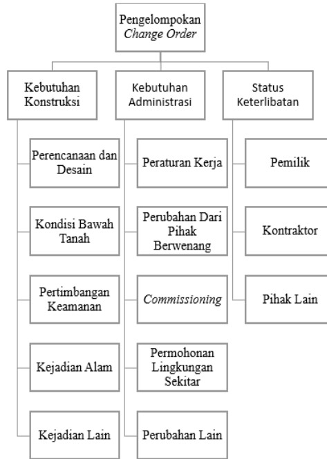
Gambar 1. Bagan pengelompokan Change Order (Sulistio dan Waty, 2008)

Berikut pengelompokan penyebab change order berdasarkan pengembangan yang dilakukan Sulistio dan Waty: