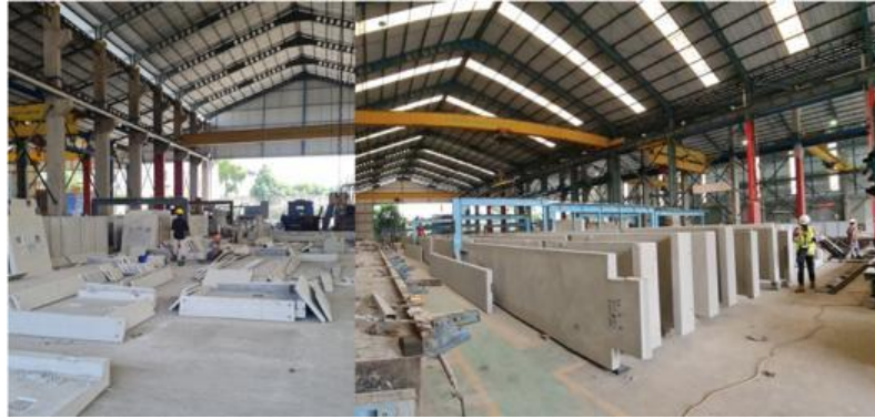
Gambar 9. Penyimpanan precast

Setelah barang sampai di lokasi proyek (Gambar 10), beton precast yang telah dikirim diperiksa kembali akan ukuran, letak serta jumlah conduit dan juga plat besi untuk bagian dimana akan di las pada balok sebagai titik tumpu penahan Precast (Gambar 11).