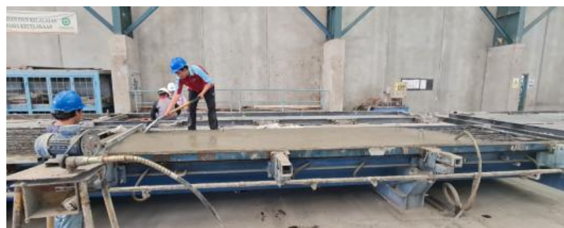
Gambar 5. Pemerataan permukaan precast