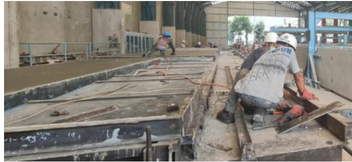
Gambar 2. Pembuatan cetakan untuk precast