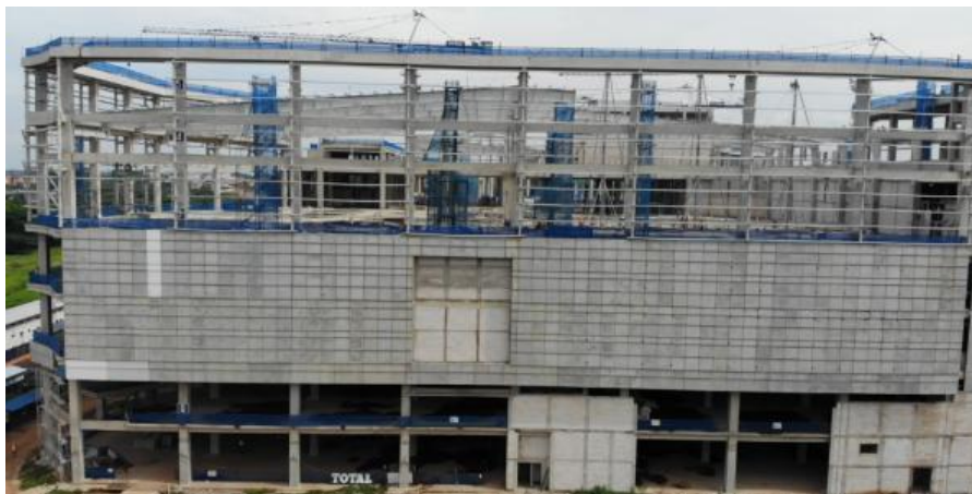
Gambar 14. Tampak depan setelah pemasangan precast pada elevasi 1

Berdasarkan pembahasan di atas mulai dari pembuatan Precast sampai dengan pemasangan terdapat beberapa permasalahan yang sering terjadi di pabrik maupun setelah pengiriman, yaitu: