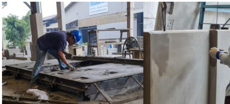
Gambar 7. Finishing precast