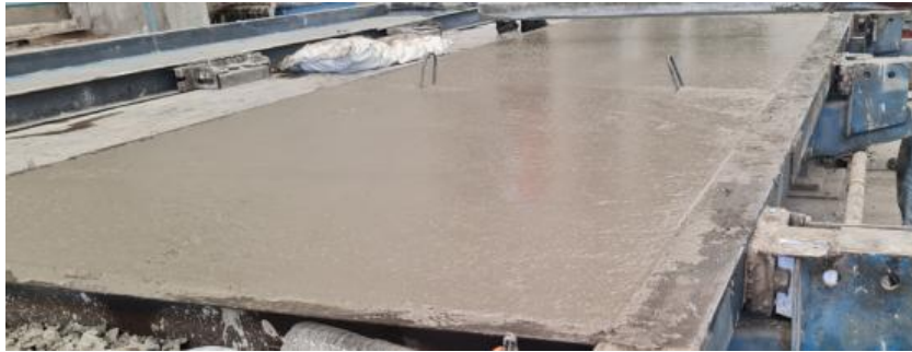
Gambar 6. Hasil pemerataan permukaan precast setelah pengecoran