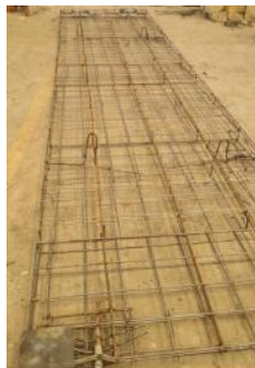
Gambar 1. Pembuatan rangkaian tulangan precast

Gambar 1 hingga Gambar 7 menunjukkan proses pembuatan beton pracetak di pabrik.