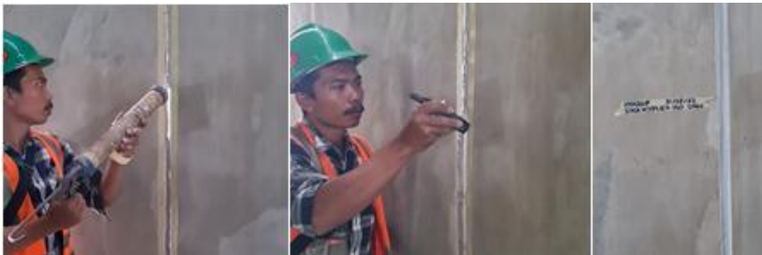
Gambar 13. Pemberian, perataan dan hasil penggunaan sikahyflex