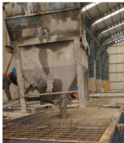
Gambar 4. Pengecoran precast