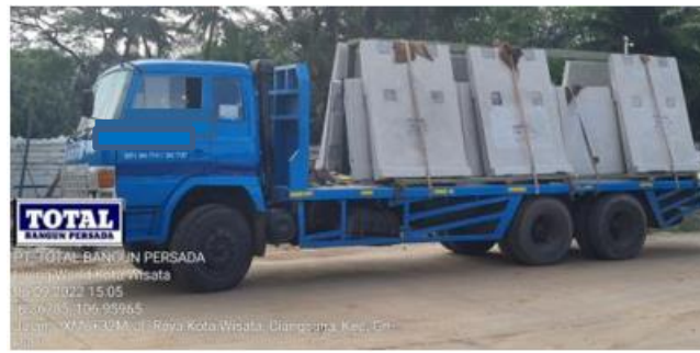
Gambar 10. Precast sampai di lokasi proyek

Setelah barang sampai di lokasi proyek (Gambar 10), beton precast yang telah dikirim diperiksa kembali akan ukuran, letak serta jumlah conduit dan juga plat besi untuk bagian dimana akan di las pada balok sebagai titik tumpu penahan Precast (Gambar 11).