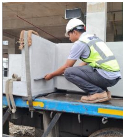
Gambar 11. Precast dilakukan pemeriksaan ukuran

Beton precast diangkat menggunakan bantuan crane dan telah dipasang plat besi untuk keperluan pemasangan ke balok induk (Gambar 12). Balok induk telah dilubangi untuk keperluan pemasangan komponen pracetak tersebut. Setelah itu, plat besi diberi cat anti karat diberi material grouting pada bagian bawah plat besi (Gambar 13.). Setelah terpasang, bagian yang masih berlubang di antara beton pracetak dilakukan pemberian sikahyflex agar air hujan tidak masuk ke dalam bagian gedung. Hasil tampak luar pemasangan beton pracetak dapat dilihat pada Gambar 14.