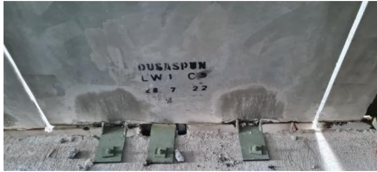
Gambar 12. Pemasangan posisi plat besi pada Precast ke balok induk