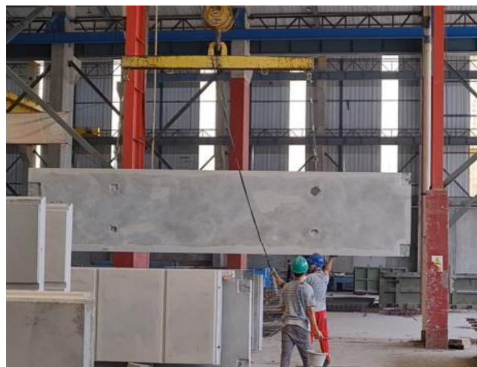
Gambar 8. Pemandangan Precast dengan Crane

Setelah pembuatan, dilakukan penyimpanan seperti ditunjukkan Gambar 8 & Gambar 9. Sementara menunggu QC dari proyek datang, dilakukan pengecekan ukuran, letak plat besi dan jumlah conduit sesuai gambar kerja di gudang pabrik XXX. Adapun batas toleransi jika adanya defect pada permukaan Precast yakni dengan lebar hingga 0,4 mm (Direktorat Jenderal Bina Marga, 2020).