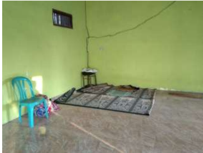
Gambar 4. Eksisting interior di Majelis Taklim

Kondisi eksisting di Majelis Taklim Al Musaadah masih kurang layak, terutama pada interior bangunan dan kurangnya fasilitas penunjang pada interior. Pada interior bangunan, plafon yang berbahan anyaman bambu sudah mulai rusak (gambar 5), penutup bouvenlight yang menggunakan bahan plastik supaya angin tidak terlalu masuk pada ruangan (gambar 6).