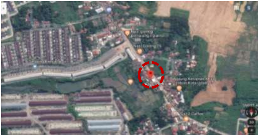
Gambar 1. Lokasi Majelis Taklim Al Musa'adah

Kondisi bangunan yang kurang layak serta kurangnya fasilitas, menyebabkan aktivitas keagamaan menjadi kurang nyaman. Pada interior bangunan kondisi plafon sudah mulai rusak, karpet pada bangunan juga hanya sedikit dan sudah kurang layak. Selain itu, fasilitas penunjang sebagai tempat keagamaan juga masih kurang, seperti; meja untuk mengaji, lemari tempat menaruh Al Qur'an, buku-buku keagamaan, serta lampu penerangan yang minim.