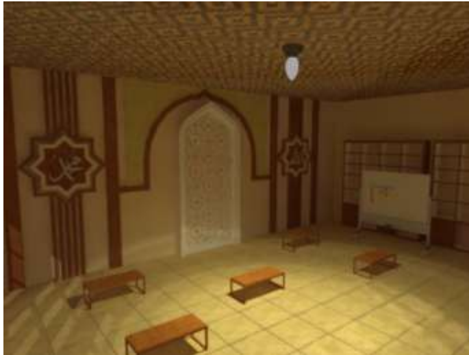
Gambar 10. Redesain Interior Majelis Taklim

Interior pada Majelis Taklim Al Musa'adah direncanakan memiliki bentuk persegi dengan bagian atas lancip berwarna putih seperti bentuk atap kubah, dengan sisi kanan kiri dan kanan beruliskan lafal sang pencipta dan Nabi Muhammad. Penggunaan dinding berwarna krem untuk memberikan kesan bersih dan terang pada ruangan.