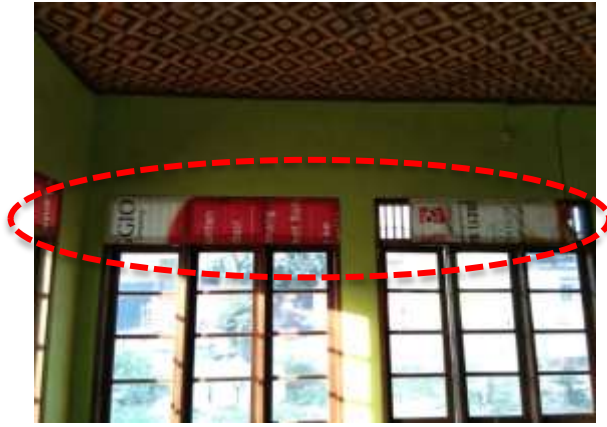
Gambar 6. Penutup bouverlight pada jendela berbahan plastik seadanya

Selain itu pada fasilitas pada interior untuk mendukung kegiatan di dalam bangunan masih sangat minim seperti; jumlah karpet yang terbatas; tidak adanya lemari penyimpanan buku-buku dan Al Qur'an, meja untuk kegiatan keagamaan juga hanya satu buah, penerangan dalam ruang yang minim serta penghawaan buatan yang berasal dari kipas angin sangat minim, karena hanya terdapat satu buah disisi barat; kurangnya buku-buku keagamaan maupun AlQur'an untuk kegiatan belajar mengaji para ibu dan anak-anak; tidak adanya white board untuk kegiatan belajar mengajar. Furniture didalam bangunan Majelis Taklim sangat terbatas hanya terdapat satu meja kecil untuk kegiatan keagamaan dan satu buah kursi plastik.