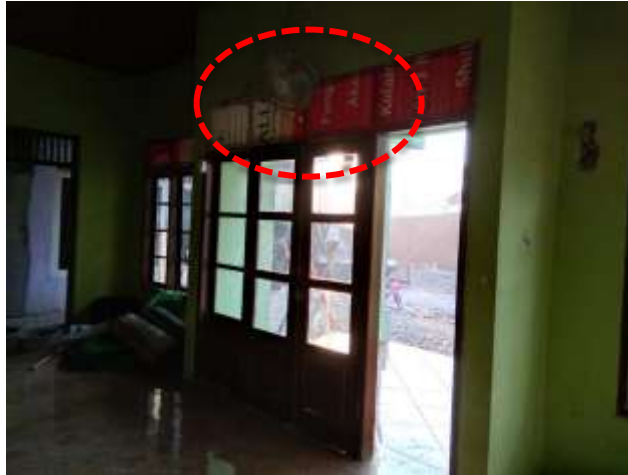
Gambar 8. Penghawaan Buatan di Majelis Taklim Al Musaadah

Bukaan pada bangunan sudah cukup banyak, terdapat pintu di sebelah barat dan utara, serta jendela di sisi timur dan selatan bangunan, sehingga saat pagi hari dan siang hari tidak terasa panas ketika berada di dalam bangunan, akan tetapi kondisi bangunan yang berada di pinggir jalan menyebabkan penghawaan alami kurang optimal sehingga diperlukan penambahan penghawaan buatan seperti kipas angin. Pada eksisting interior Majelis Taklim belum menerapkan arsitektur islam secara optimal, seperti; tidak adanya hiasan atau ornamen pada dinding, penggunaan warna hijau pada eksisting Majelis sudah menerapkan warna alami sesuai konsep arsitektur islam, tetapi warna pada dinding sudah mulai pudar.