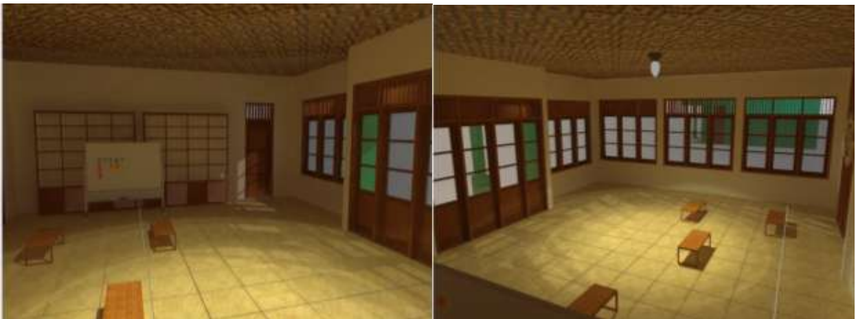
Gambar 11. Redesain Prespektif Interior Majelis Taklim

Interior pada Majelis Taklim Al Musa'adah direncanakan memiliki bentuk persegi dengan bagian atas lancip berwarna putih seperti bentuk atap kubah, dengan sisi kanan kiri dan kanan beruliskan lafal sang pencipta dan Nabi Muhammad. Penggunaan dinding berwarna krem untuk memberikan kesan bersih dan terang pada ruangan.