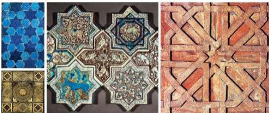
Gambar 3. Contoh bentuk geometri pada elemen dinding arsitektur islam

Bentuk geometri berpengaruh besar dalam perkembangan karya seni pada peradaban islam, desain struktur gaya keseniannya menggunakan pola-pola geometri berbentuk garis, lingkaran dan pola lainnya yang tersusun membentuk satu kesatuan yang mengandung makna spiritual dan memiliki nilai estetika atau keindahan yang tinggi. Dengan menggunakan konsep geometri pada matematika, kesenian islam dapat membentuk suatu estetika yang bernilai tinggi.