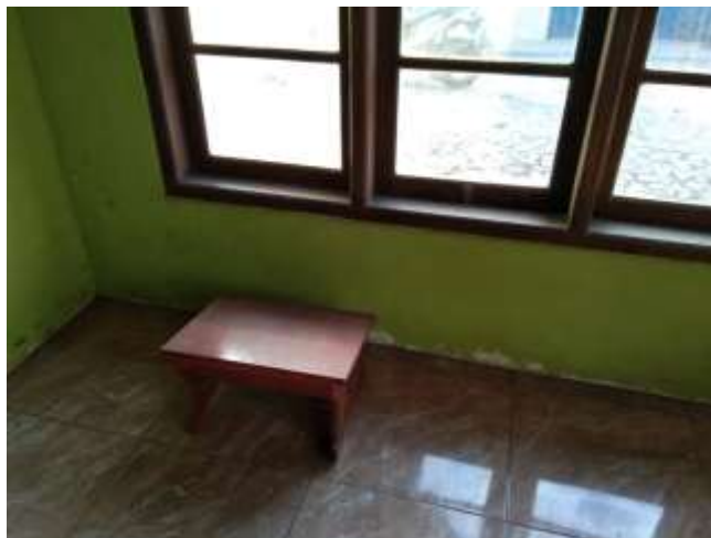
Gambar 7. Keterbatasan prasarana untuk kegiatan di Majelis Taklim Al Musaadah

Selain itu pada fasilitas pada interior untuk mendukung kegiatan di dalam bangunan masih sangat minim seperti; jumlah karpet yang terbatas; tidak adanya lemari penyimpanan buku-buku dan Al Qur'an, meja untuk kegiatan keagamaan juga hanya satu buah, penerangan dalam ruang yang minim serta penghawaan buatan yang berasal dari kipas angin sangat minim, karena hanya terdapat satu buah disisi barat; kurangnya buku-buku keagamaan maupun AlQur'an untuk kegiatan belajar mengaji para ibu dan anak-anak; tidak adanya white board untuk kegiatan belajar mengajar. Furniture didalam bangunan Majelis Taklim sangat terbatas hanya terdapat satu meja kecil untuk kegiatan keagamaan dan satu buah kursi plastik.