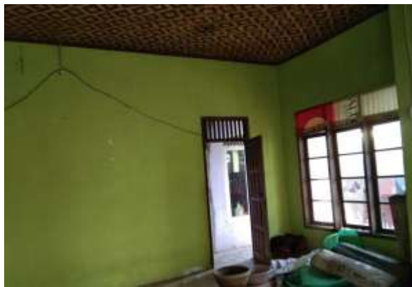
Gambar 5. Kondisi eksisting yang kurang layak pada plafon bangunan