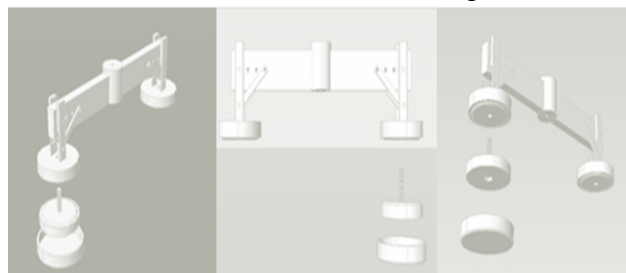
Gambar. 3.4. Desain Konsep 2