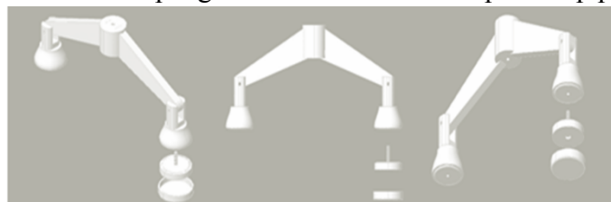
Gambar 3.3 Desain konsep 1