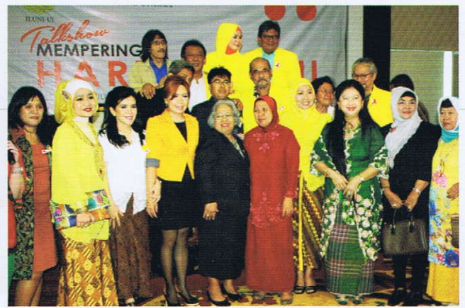
Foto Bersama para pembicara dan Panitia