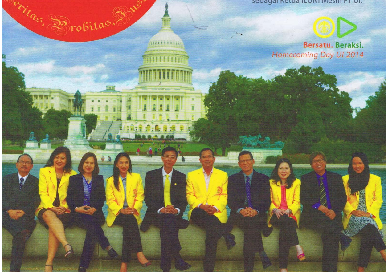
Kunjungan kerja Direktorat Hubungan Alumni UI ke Amerika Serikat

Bersatu. Beraksi. Homecoming Day UI 2014