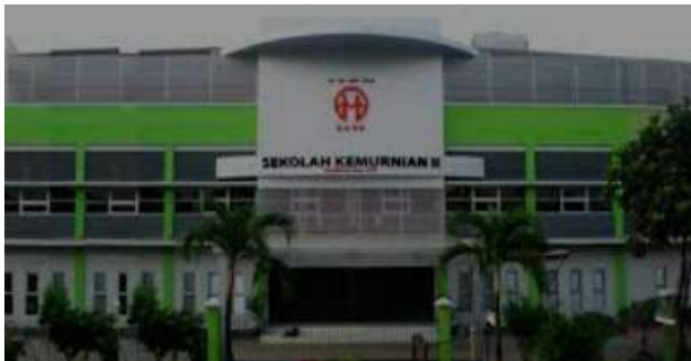
Gambar 1 Gedung Sekolah SMA Kemurnian II