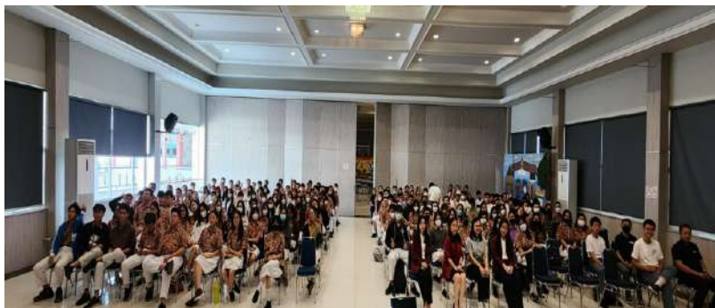
Foto Bersama Tim PKM FEB UNTAR dan Peserta Pelatihan dari SMA Kemurnian II