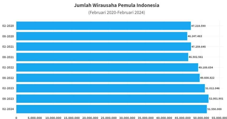
Gambar 2. Jumlah wirausaha pemula Indonesia

Berdasarkan Tabel 1, bisa disimpulkan bahwa adanya peningkatan pengangguran tiap tahunnya hanya dari mereka yang berpendidikan hingga universitas. Orang yang hanya berpendidikan sampai SMP cenderung lebih sedikit jumlah penganggurannya. Pengetahuan Gen-Z terhadap kewirausahaan adalah faktor yang perlu dipertimbangkan. Pengetahuan ini mencakup pemahaman tentang cara memulai, mengelola, hingga mengembangkan bisnis. Akses untuk mendapatkan pendidikan kewirausahaan, pelatihan dan sumber daya informasi sangat penting untuk menjalankan usaha. Pengetahuan kewirausahaan akan menjadi pertimbangan Gen-Z dalam menjalankan bisnis. Pengetahuan kewirausahaan dapat didefinisikan sebagai apresiasi kepada individu terhadap keterampilan, mentalitas, dan konsep kewirausahaan yang diharapkan dari pencipta usaha menurut Donova, Widjaja dan rekan lainnya tahun 2023.