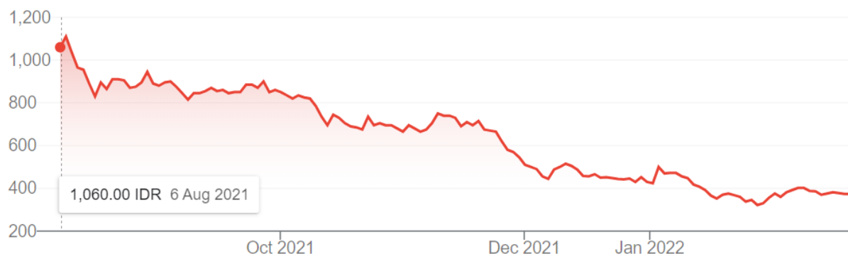
Grafik 3. Tren Harga Saham Bukalapak dari 6 Agustus 2021 – 18 Februari 2022