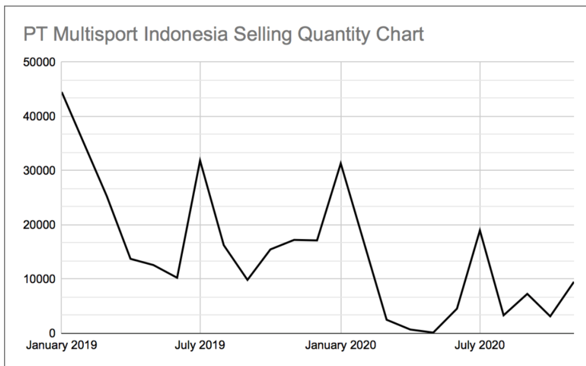
Gambar 1. Tingkat Penjualan PT Multisport Indonesia

kondisi keuangan perusahaan pada saat ini atau suatu periode tertentu. Laporan keuangan yang diterbitkan oleh perusahaan merupakan cerminan dari kinerja keuangan perusahaan, laporan keuangan merupakan hasil akhir dari proses akuntansi yang disusun dengan tujuan untuk memberikan informasi keuangan bagi suatu perusahaan (Kurniati, 2019).