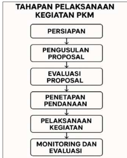
Gambar 1. Diagram Alir Kegiatan PKM

peluang kolaborasi lanjutan antara universitas dan institusi pendidikan menengah. Berikut ini tampilan Diagram alir: