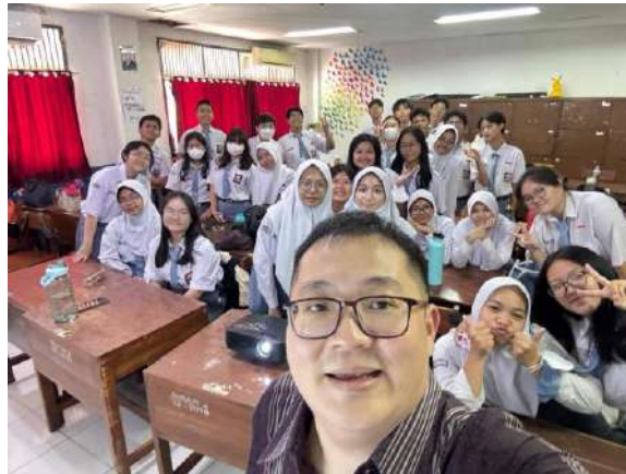
Gambar 2. Siswa-Siswi SMAN 2 Jakarta

Capaian tersebut menunjukkan bahwa kegiatan PKM ini berhasil mencapai tujuan awal, yaitu meningkatkan pemahaman dan keterampilan praktis akuntansi di kalangan siswa. Dampak jangka panjang yang diharapkan meliputi peningkatan kualitas pembelajaran akuntansi di SMAN 2 Jakarta, meningkatnya minat siswa terhadap bidang akuntansi dan keuangan, serta kontribusi terhadap pencapaian outcome pendidikan yang lebih baik.